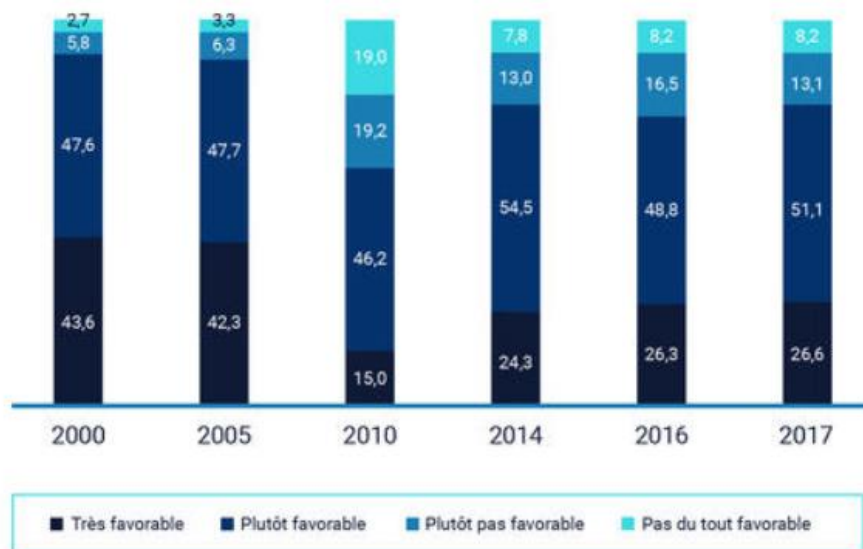
Figure 1 : Évolution de l'adhésion à la vaccination (en %) parmi les 18-75 ans, en France, de 2000 à 2017.

Sources : Baromètres santé 2000, 2005, 2010, 2014, 2016, 2017, Santé publique France.