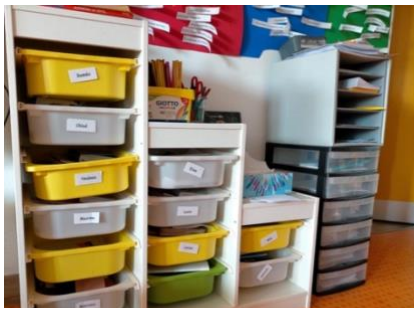
Figure 6: organisation matérielle de Sonia présent en annexe 9