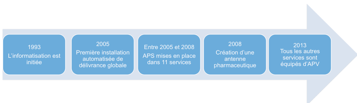
Figure 2. Chronologie de la sécurisation du circuit du médicament au CHUGA.

Dans le but de sécuriser la délivrance des médicaments, le CHUGA a mis en place des mesures depuis plusieurs années.