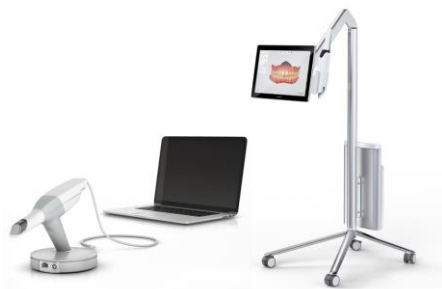
Figure 5 : Camera optique pour empreinte numériques et conception fabrication assiste par ordinateur

Cette technique consiste dans un premier temps à réaliser une empreinte, dite optique, à l'aide d'une caméra intra-orale. Cette empreinte va ensuite être envoyée à un ordinateur 39 . La prothèse est conçue virtuellement et les informations nécessaires à sa réalisation sont transmises à la machine qui va concevoir la prothèse, généralement par soustraction à partir d'un bloc de matériau. Ainsi, cette technique permet de réaliser la prothèse au sein du cabinet dentaire éliminant ainsi le trajet vers le prothésiste. Même si le cabinet n'est pas doté de la machine mais uniquement de la caméra intra-orale, cela supprime le trajet pour venir chercher l'empreinte. Cette méthode permet de réduire considérablement l'impact environnemental, supprimant tout déchet de matériau, d'emballage de matériau d'empreinte, ainsi que les trajets d'acheminement entre cabinet dentaire. 40