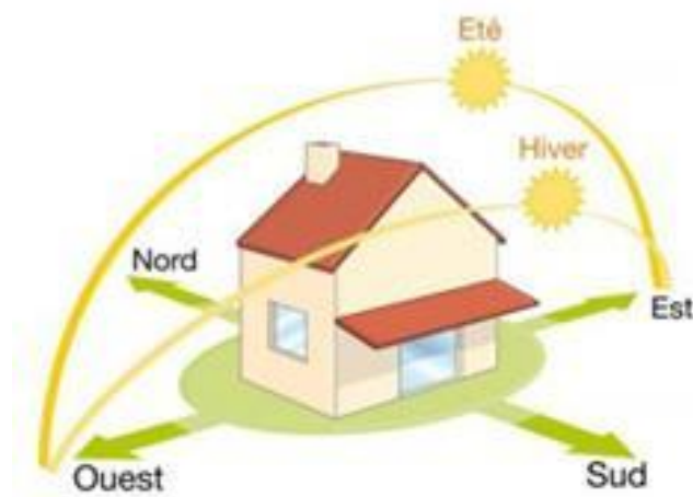
Figure 4 : Exposition au soleil en fonction des saisons