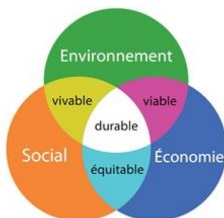
Figure 3 : Les piliers du développement durable