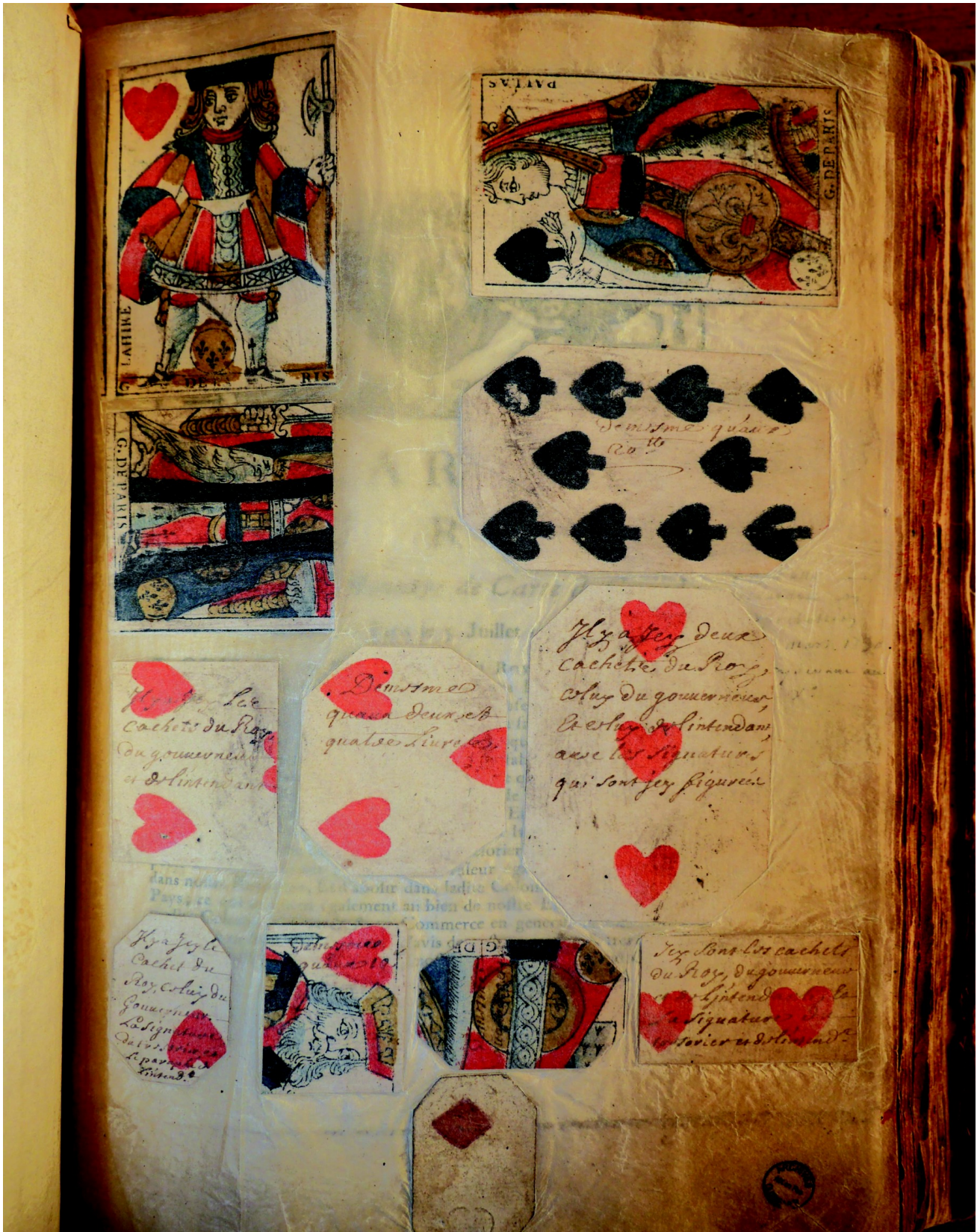
Annexe 2 : Monnaie de carte en circulation en Nouvelle-France en 1714.(ANOM COL A vol.21 fol.125bis-125bisv.)