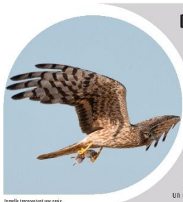
Femelle perchée sur une perche