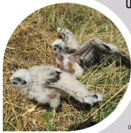
Jeune de busard cendré au sol