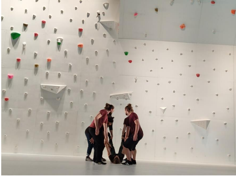
Figure 10 Vol de Lorïc Foucherou, MC2, répétitions en avril.

porteurs par rapport au mur et la réaction rapide des voltigeurs pour s'y accrocher exigent davantage de précision. Durant la répétition, un autre voltigeur ou Nina Caprez restent sur le mur, à côté de l'accroche d'où il va se tenir le voltigeur depuis le sol pour certifier sa sécurité. Chaque fois, cinq porteurs entourent un voltigeur. Chacun le tient par un de ses pieds ou de ses mains, de manière que son corps ouvre comme s'il était une étoile de la mer. Ils le font se lever