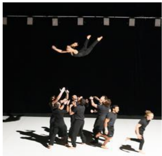
Figure 22 © Ian Grandjean, Möbius.

Ils se mettent à un rythme de marche continu, qui s'habite par des portés et des sauts acrobatiques. Cette vitesse de changement des niveaux surprend le spectateur qui n'arrive pas à s'apercevoir des allers-retours incessants, dont le vol d'acrobates devient l'élan. Une voltigeuse saute, comme si elle voulait s'allonger, au centre du plateau et six porteurs la rattrapent chacun par un de ces côtés : un la prend par ses épaules et un autre par ses deux pieds, pendant que les restes se mettent par deux à droite et à gauche, pour rattraper les haut et le bas de son corps. Ils la poussent en l'air, comme si elle était une étoile de mer et ils la rattrapent. Ils suivent plusieurs sauts pareils entre les voltigeurs, qui échangent souvent dans l'air des