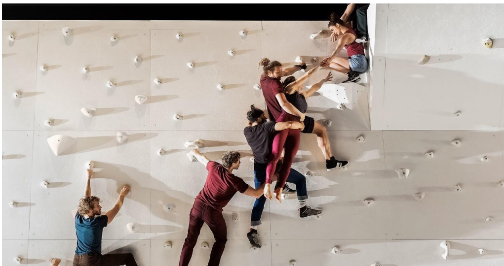
Figure 9 ©Pascale Cholette, Dégoulinade

Pendant cette résidence, les performeurs essaient d'avancer sur l'écriture de la deuxième partie. Ils reprennent le fil depuis les sauts du mur au gymnase. Il s'agit de la séquence de la