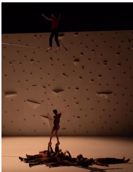
Figure 20, Corps extrêmes, festival Montpellier danse 2021.