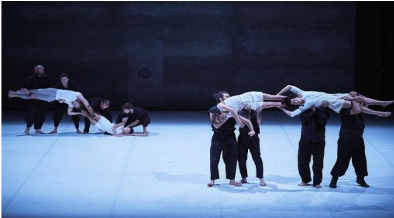
Figure 23 © Christophe Raynaud de Lage, Möbius .

concentrer sur un seul mouvement avant qu'il se plonge de nouveau dans l'élan du continuum de la chorégraphie. Les acrobates reprennent par une séquence de construction