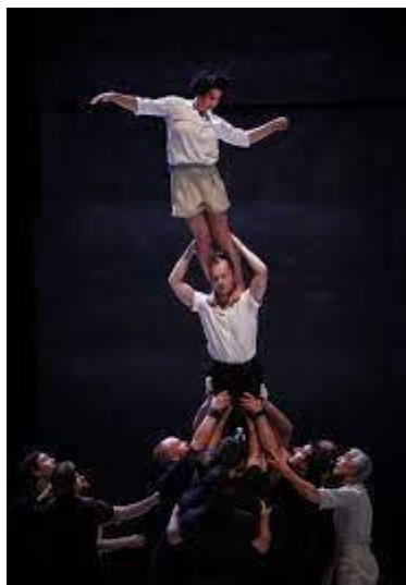
Figure 24 © Christophe Raynaud de Lage, Möbius .

La séquence suivante se qualifie par le contraste entre l'ensemble et l'unité. Chaque fois, un acrobate s'éloigne de la foule des autres en courant et il essaye de revenir vers le groupe pour l'intégrer de nouveau. La foule le pousse parfois loin comme s'il les avait trahis