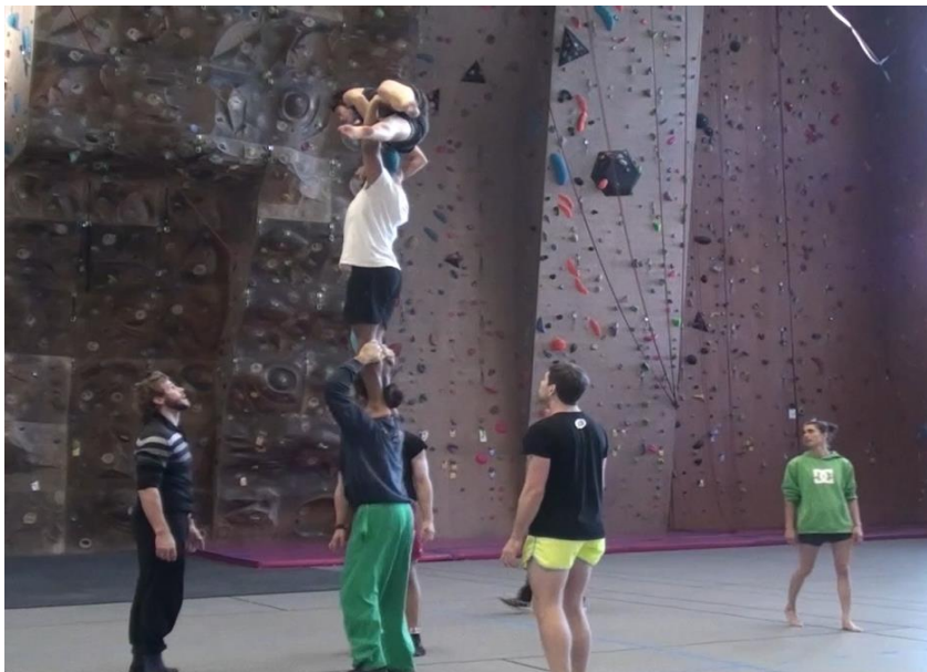
Figure 2, extrait de la répétition, au centre sportif Berthe de Boissieux 30.10.2021.