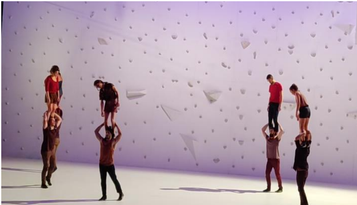
Figure 15 © Danaï Papadopoulou, Colonnes finales , Annecy, mai 2021.

Elle suit une marche collective où chacun des porteurs construit une colonne avec un autre performeur. Cinq colonnes de dix personnes commencent, ainsi, à se déformer successivement en éprouvant des déséquilibres.