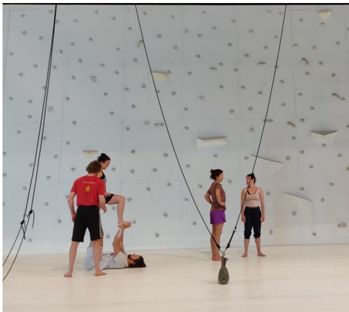
Figure 13 © Danai Papadopoulou, Longes et équilibres , répétitions à Annecy, mai 2021.

Le spectacle se prépare pour la dernière ligne droite. Nous sommes cette fois sur le plateau de la scène nationale Bonlieu à Annecy. La scénographie est installée et le mur est complètement blanc sans les accroches colorés que les acrobates utilisaient pendant les résidences précédentes. L'ambiance me semble moins ludique lors de mon arrivée le 09 mai. Rachid Ouramdane m'accueille en me disant qu'il est en train de réfléchir autour de la dernière séquence de la chorégraphie. Il laisse les performeurs s'échauffer tranquillement. Chacun prend un moment pour écouter son corps ou retravailler un porté avec ses partenaires.