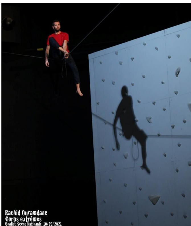
Figure 17, photo de Nathan Paulin, répétition 10.05.2021.

Qu'amène cette figure, qui balance le centre de son poids à chaque instant qu'elle essaie de se tenir debout sur le fil ? Nathan Paulin rentre sur le plateau et traverse la slackline au son