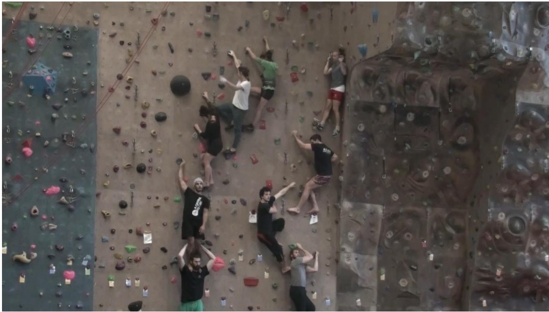
Figure-1 © Danaï Papadopoulou, Essais sur le mur du centre sportif au centre sportif Berthe de Boissieux, photo prise pendant la répétition en octobre 2020.

ensemble en faisant des colonnes des trois qui se créent quand ils sont encore sur le mur.