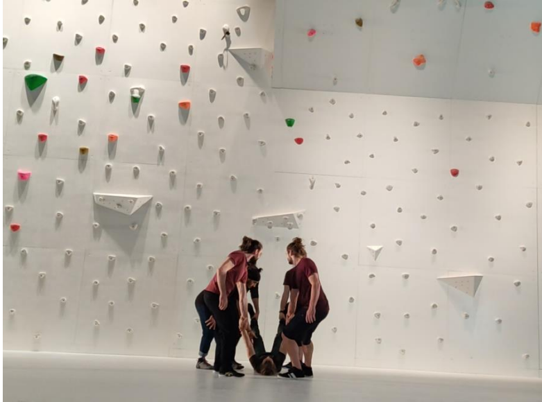
Figure 10 Vol de Lorïc Foucherou, MC2, répétitions en avril.

porteurs par rapport au mur et la réaction rapide des voltigeurs pour s'y accrocher exigent davantage de précision. Durant la répétition, un autre voltigeur ou Nina Caprez restent sur le mur, à côté de l'accroche d'où il va se tenir le voltigeur depuis le sol pour certifier sa sécurité. Chaque fois, cinq porteurs entourent un voltigeur. Chacun le tient par un de ses pieds ou de ses mains, de manière que son corps ouvre comme s'il était une étoile de la mer. Ils le font se lever