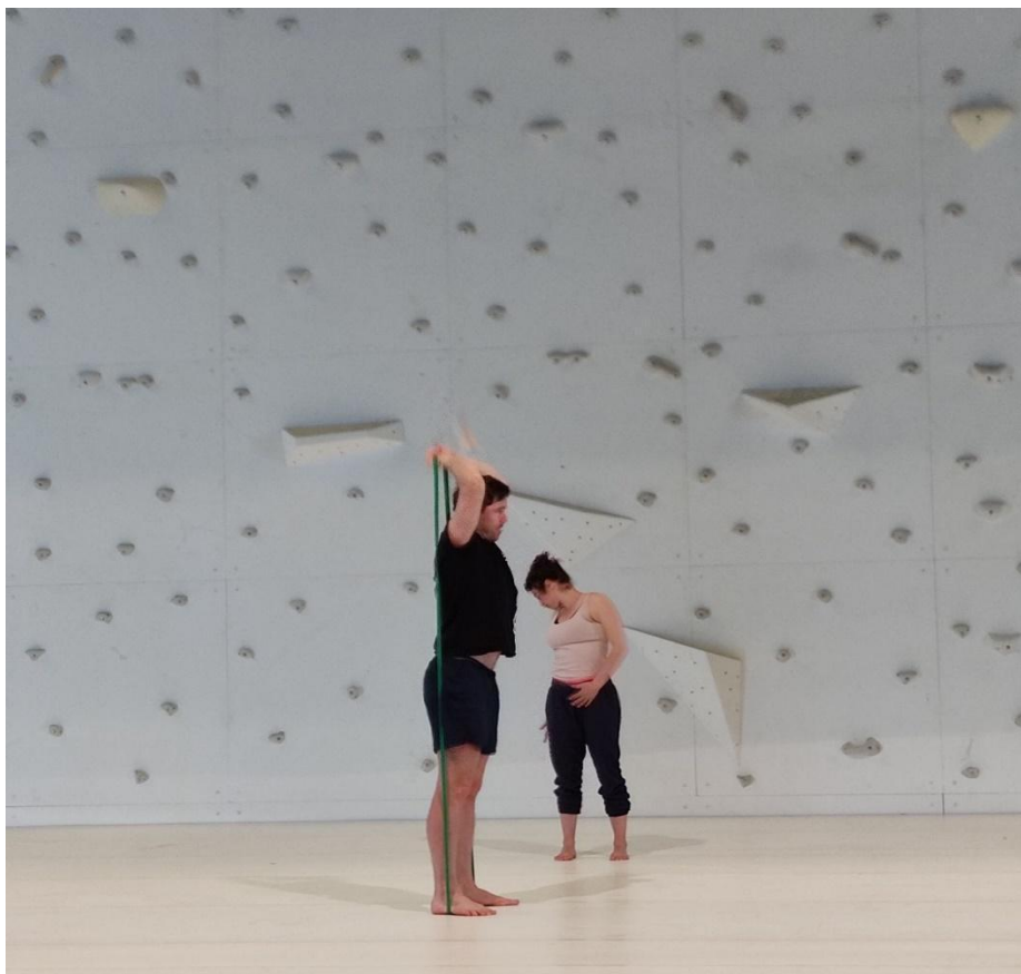
Figure 5 © Danai Papadopoulou, Echauffement en élastique et étirements pendant la répétition , P. Freeman et A. Caen, photo de scène nationale Bonlieu à Annecy 73 .

Nous sommes toujours dans la même salle de la MC2 où le mur et le sol sont restés installés après la résidence de mars. Tout me semble encore plus familier, même le labyrinthe à l'intérieur du bâtiment pour trouver le plateau. La plupart de performeurs, rassemblés tranquilles sur le plateau, s'échauffent chacun individuellement et en silence sans parler. Ils font des petits étirements en insistant sur l'échauffement des articulations de leurs bras et de leurs pieds. Certains utilisent également des élastiques pour s'étirer.