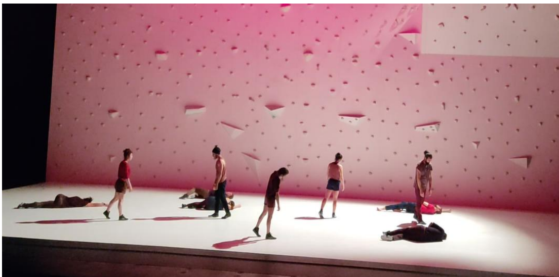
Figure 16 © Danaï Papadopoulou, Dernière séquence pendant le filage , Annecy, mai 2021.

Tous les performeurs marchent ensemble en déséquilibre sur le plateau comme s'ils cherchaient à s'orienter dans l'espace. Ils s'allongent tous par terre sauf Yamil Falvella et Airelle Caen. Le porteur traverse lentement le plateau vers la sortie pendant que les autres performeurs le suivent progressivement. Seule la voltigeuse reste sur la surface blanche, comme si elle était perdue. La musique se fond petit à petit et Airelle Caen s'éloigne dans le silence sous une lumière qui s'éteint.