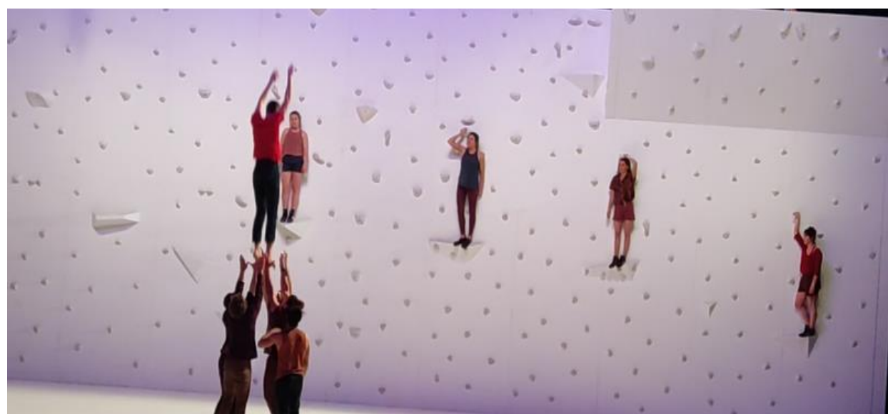
Figure 14 Saut de Nathan Paulin , Annecy, mai 2021.

Avant qu'ils commencent, ils se concentrent tous autour du chorégraphe pour regarder la vidéo de la dernière répétition. Le spectacle se termine de manière cyclique dans un effort des performeurs pour se rapprocher de Nathan Paulin qui, étiré par ses bras, laisse le fil pour atterrir sur le câlin des porteurs, qui l'attendent sur le plateau.