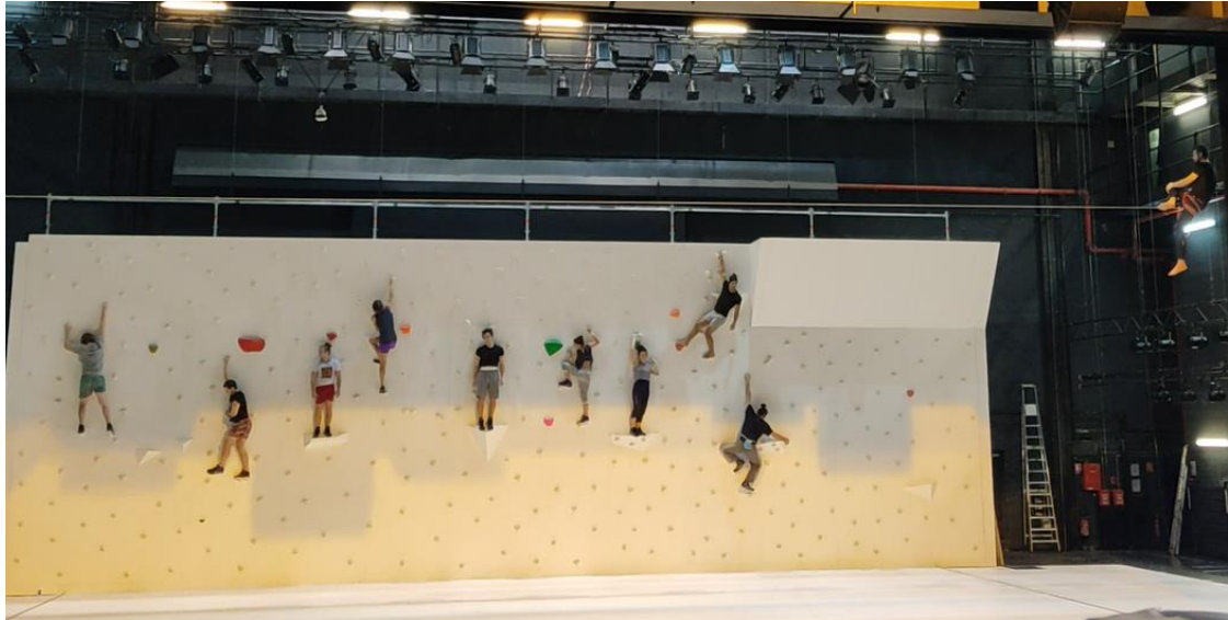
Figure 3 Essais des acrobates, répétitions à la MC2, mars 2021.

Rachid Ouramdane leur demande d'apparaître tous sur le haut du mur pendant que Nathan Paulin traverse le fil de la slackline . Les acrobates font des essais permanents pour trouver le chemin de leur descente au plateau.