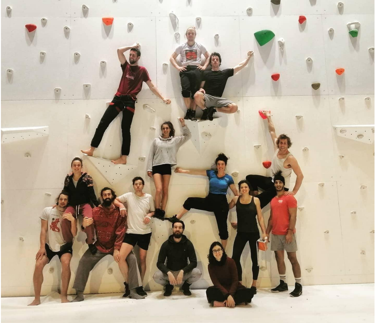
Figure 26 Photo avec le collectif des performeurs des Corps Extrêmes, MC2, Mars 2021.