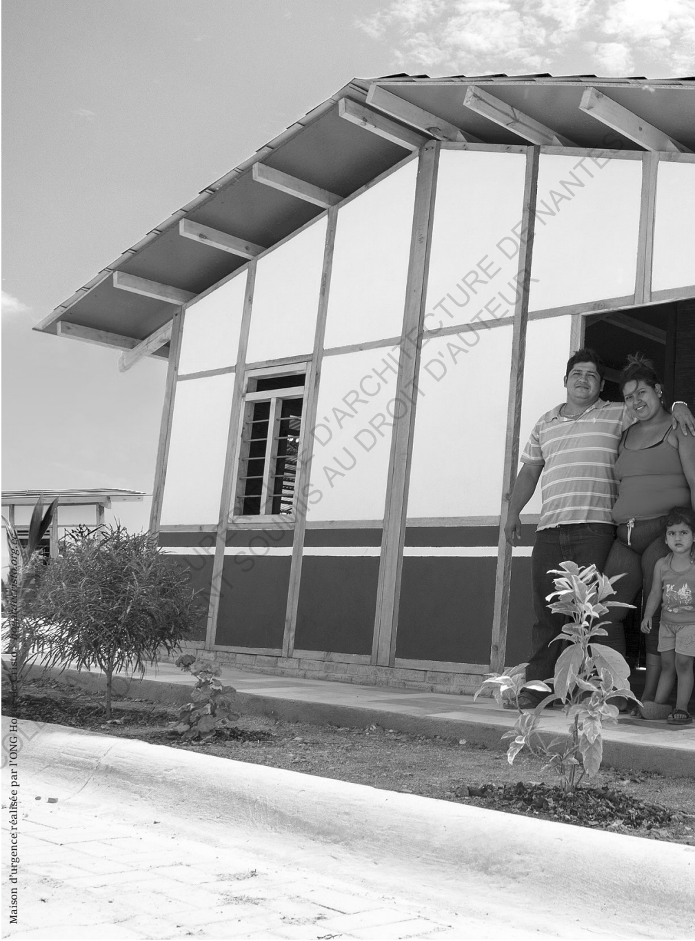
Maison d'urgence réalisée par YONG HO