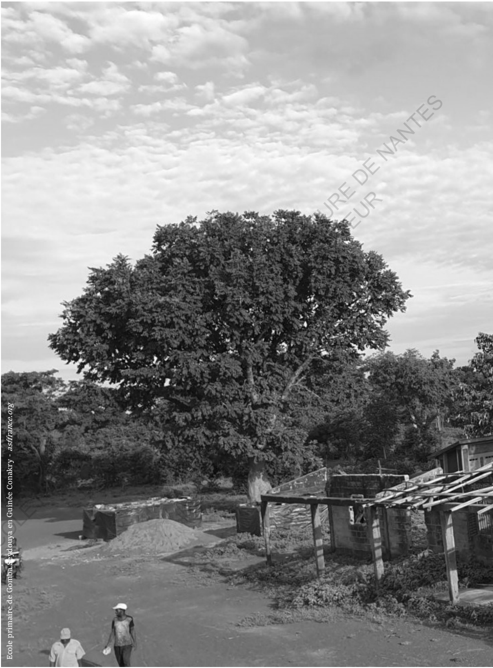
Ecole primaire de Gomba, Fylouya en Guinée Conakry