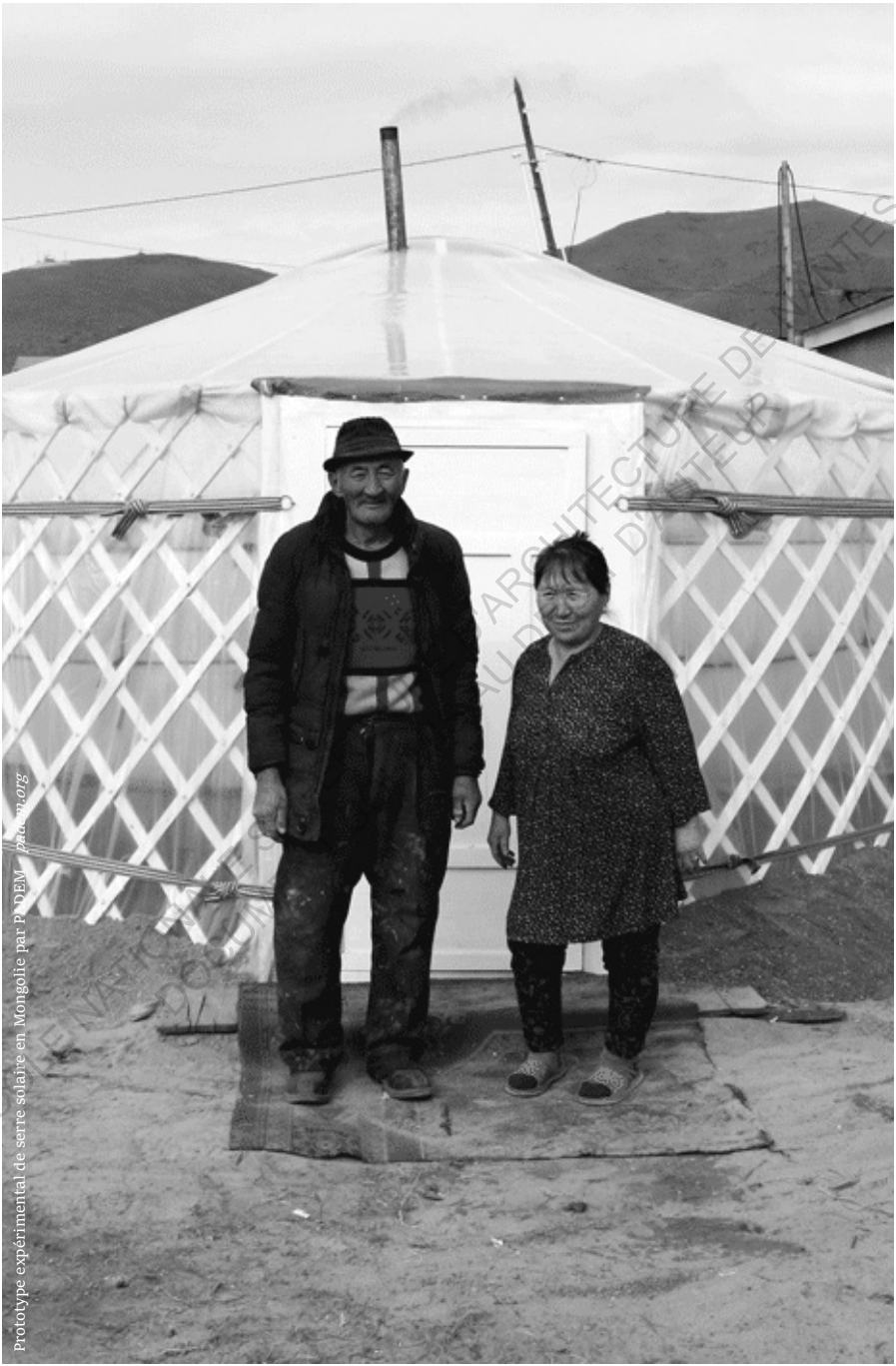
Prototyppe expérimental de serre solaire en Mongolie par P'DEM - patam.org

ECOLENANTAUCO AU D'ARCHITECTURE DE NANTES D'ITEUP NANTES