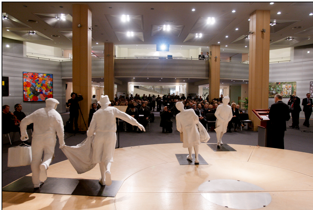
Image 4 - Photographie, cérémonie, 27 janvier 2010, Bruxelles

religieuses, que ce soit le cierge que l'on allume à l'Eglise ou les six bougies du chandelier de Hanoukka. En 2012 et 2013, le rabbin Israel Meir Lau participe à la cérémonie.