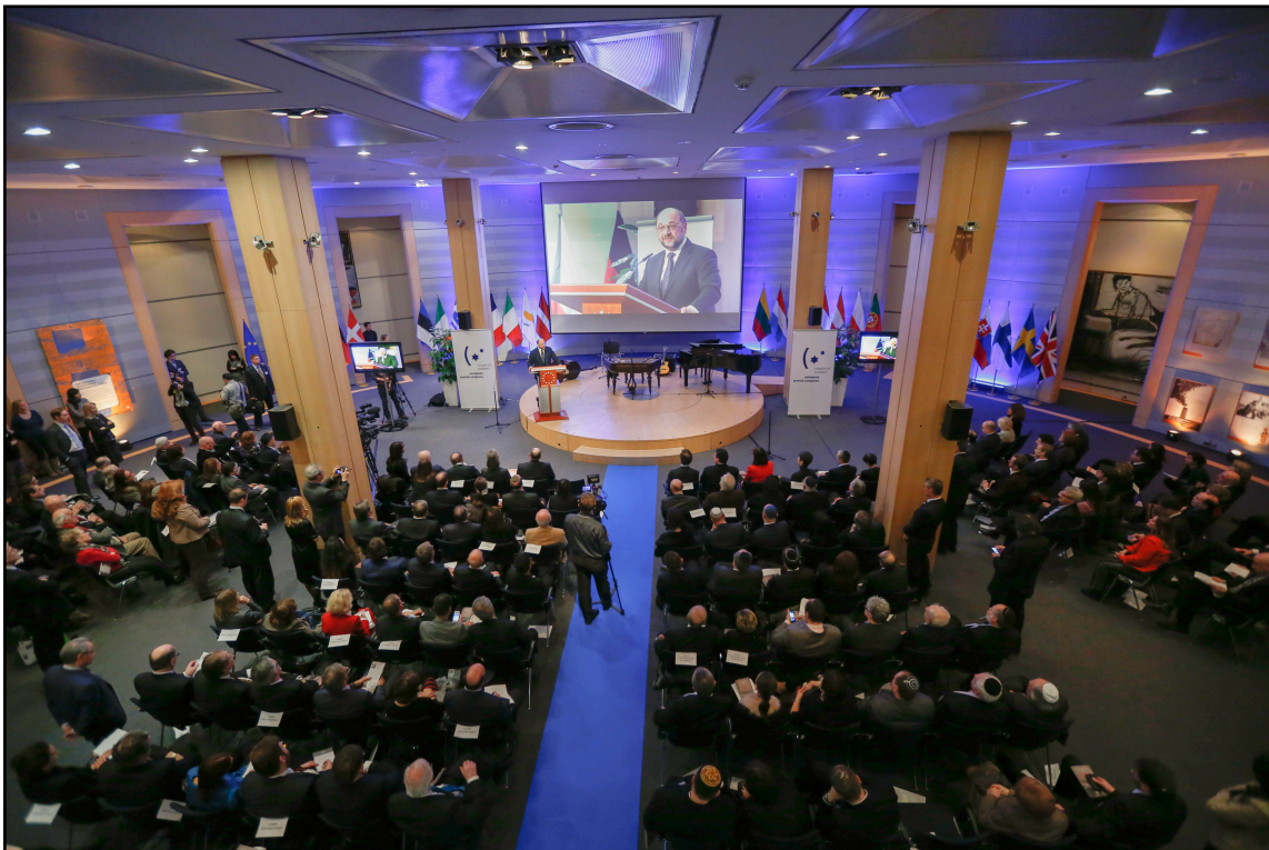
Image 3 - Cérémonie à Bruxelles, 22 janvier 2013, locaux du Parlement européen, Martin Schulz