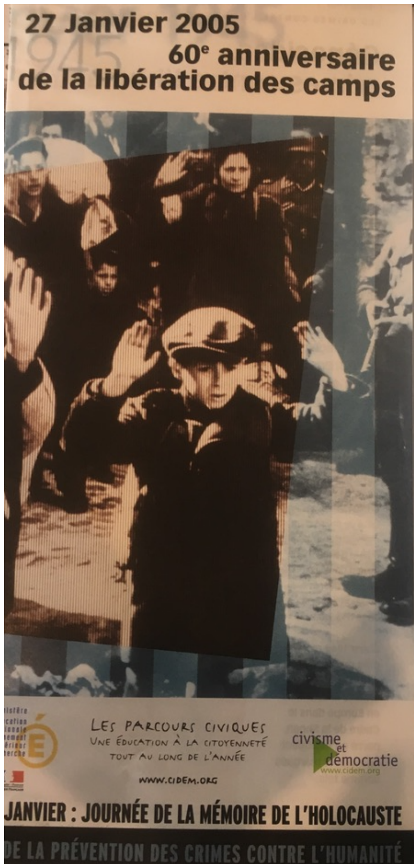
Annexe 14 : Dépliant, 60e anniversaire de la libération des camps, civisme et démocratie.