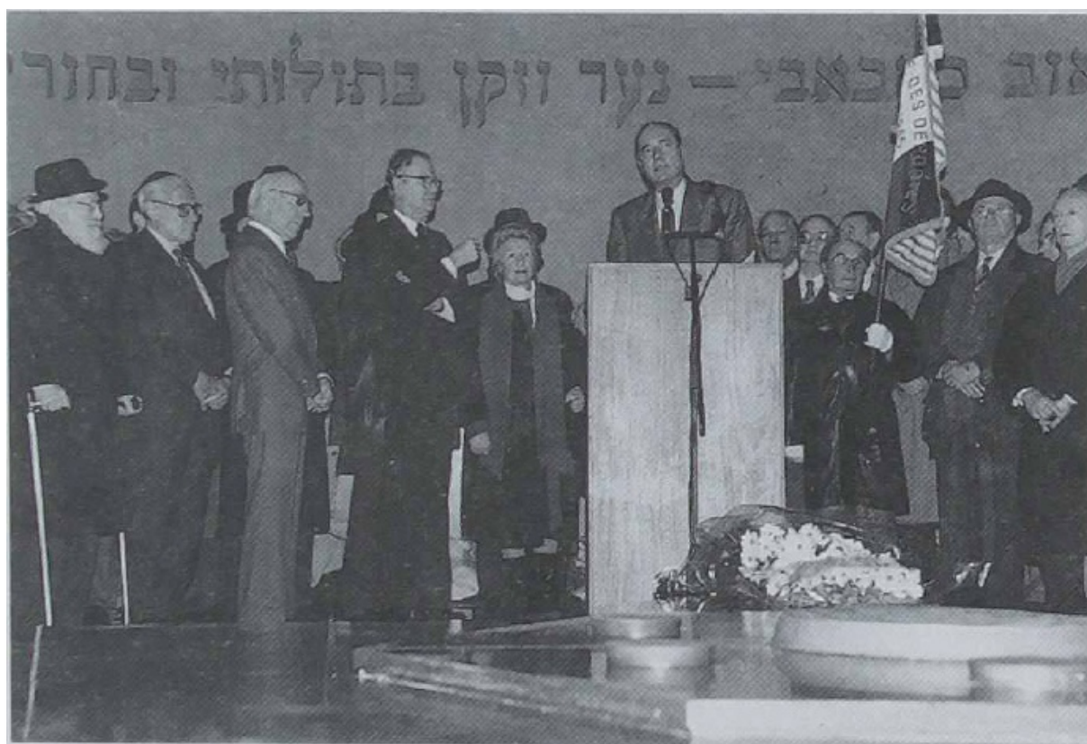
Image 5 - Inauguration du Mémorial du martyr juif inconnu, Paris, 25 janvier 1995.