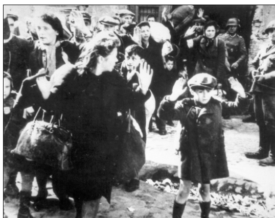
Image 7 – Photographie, Varsovie, auteur anonyme. Titrée par l'usage « Garçon du ghetto de Varsovie ».

établissement du secondaire, une heure de cours soit consacrée à la mémoire des victimes de la Shoah » 40 . Plusieurs modèles de victimes de la Shoah sont alors proposées. Le numéro d'Histoires vraies, dont on a montré la couverture plus haut 41 , propose des « fiches à collectionner », dont une représentant Anne Frank accoudée à son pupitre d'écolière. Le dépliant préparé par le CIDEM est illustré par la photo souvent intitulée Garçon du ghetto de Varsovie 42 .