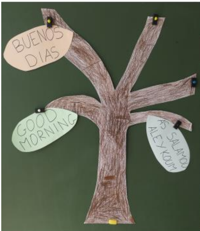
Ajout Buenos Dias