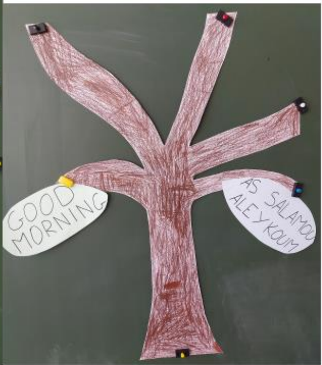
Ajout As Salamou Aleykoum