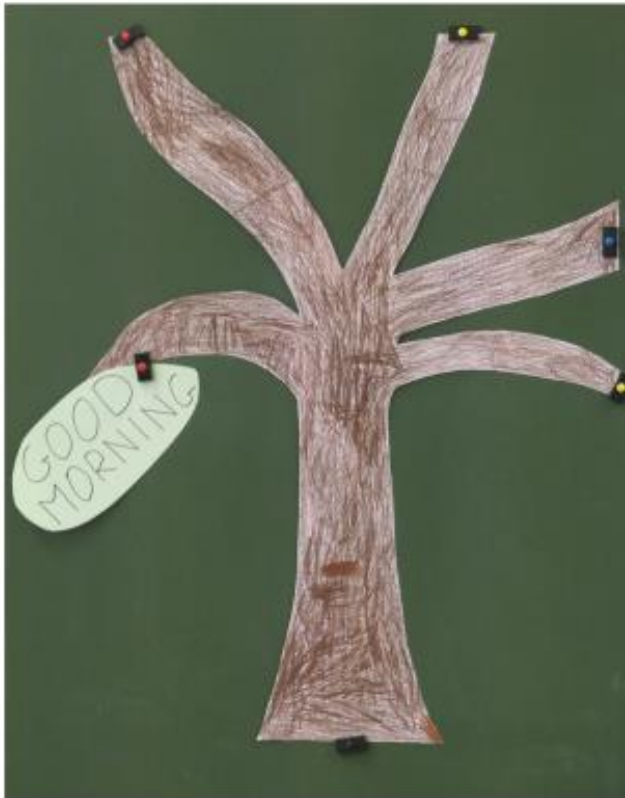
Ajout Good Morning