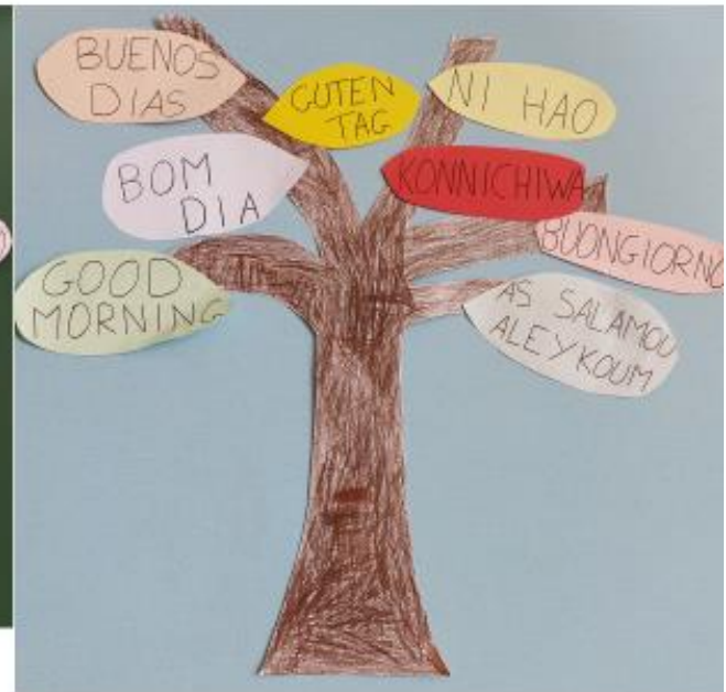
Ajout Guten Tag