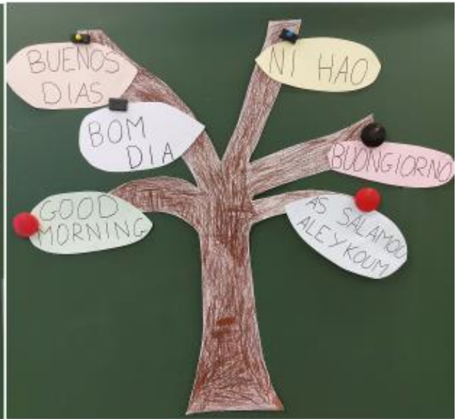
Ajout Bom Dia