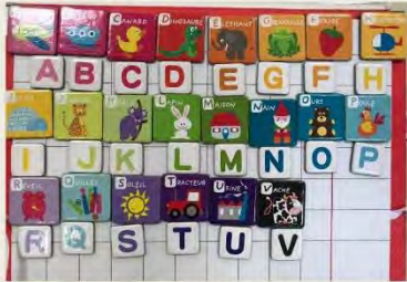
Vaïana et Alishan rangent les lettres de l'alphabet et les mots associés.

L'alphabet / Le petit chaperon rouge / Exprimer les émotions / Critique de Rhania / Les petits mots / Les pronoms