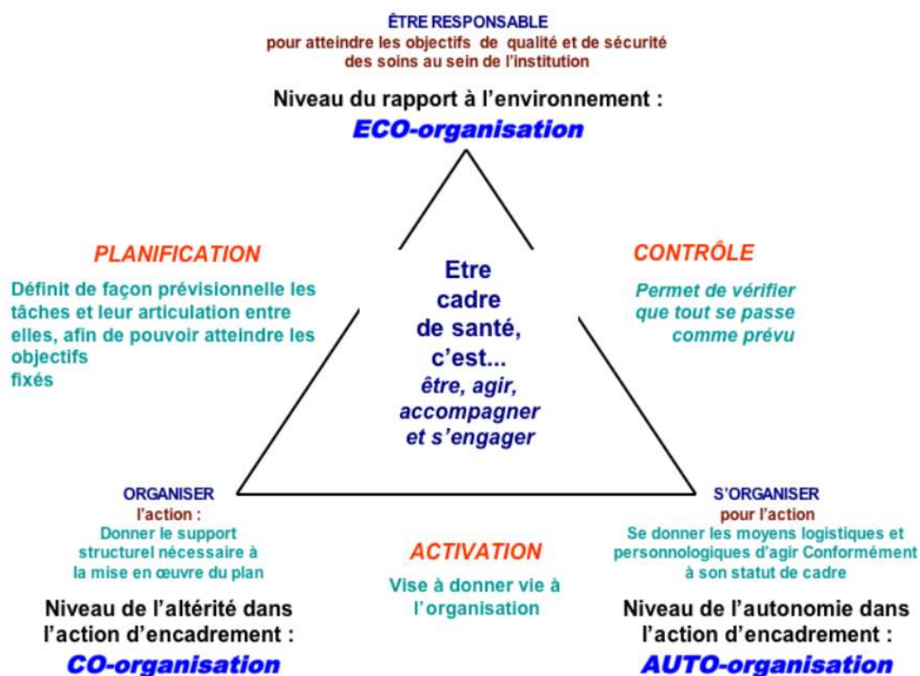
Figure N°1 : Profil dynamique du cadre de santé (d'après P. Peyré, cf. note 15)

Ses activités sont fragmentées, menées à un rythme soutenu. « Les sollicitations sont de plus en plus nombreuses, les prises de décision doivent être plus rapides et les concertations se font plus rares, par manque de temps. Son temps de travail est compté 17 . »