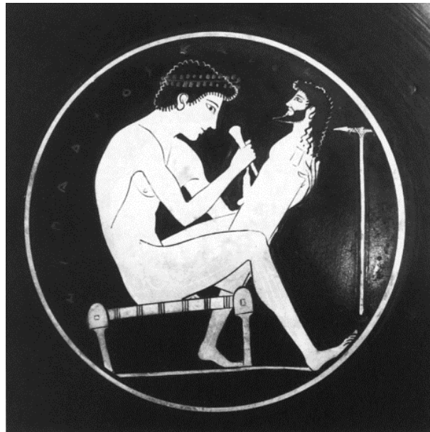
Un hermogluphos sculptant un hermès dans du bois, un matériau souple. Coupe attique, vers 515, attribué à Épictète, National Museum, Copenhague, Chr. VIII 967. Dans Woodford (2007), p. 2.

Néanmoins, cette analyse ne semble pas entièrement convaincante. En effet, parmi les modèles statuaires grecs, l'hermès se caractérise précisément par des formes très diverses qui ont grandement évolué entre le VI e siècle avant notre ère et l'époque impériale. Il peut être sculpté dans la pierre ou modelé dans des matériaux plus souples comme la terracotta ou le bois ; il peut montrer une tête ou un buste entier ; il peut comprendre une seule tête ou deux têtes dos à dos ; il peut représenter Hermès, une autre divinité ou même une personnalité humaine ; Hermès peut être montré comme un homme d'âge mûr, avec une barbe, ou plus tard comme un jeune homme imberbe ; il peut être orné d'un phallus ou non 1 . Les représentations des hermès sont diverses et souples et ne correspondent donc pas à l'idée d'un art strictement codifié, rigide et imperméable comme l'affirme J. Romm.