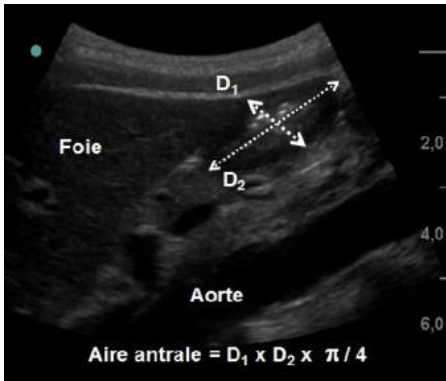
Figure 2 : Mesure de l'aire de section antrale

Après examen échographique de l'antra, l'estomac était défini comme non vide s'il présentait un des 2 critères suivants : grade Perlas 2 ou grade Perlas 1 associé à une aire antrale > 340 \text{ mm}^2 . Inversement, un estomac vide était défini par un score de Perlas à 0 ou 1 avec une aire antrale < 340 \text{ mm}^2 .