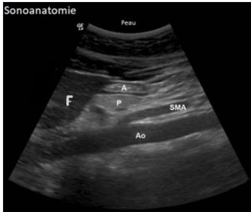
Figure 1 : Sonoanatomie d'une image d'échographie antrale

Tous les patients bénéficiaient d'un examen en position semi-assise, puis en décubitus latéral droit. L'antrum gastrique était visualisé dans un plan sagittal, au niveau du creux épigastrique. Le lobe hépatique gauche, le pancréas, les vaisseaux mésentériques, et l'aorte ou la veine cave inférieure servaient de repère anatomique (18,19,22,23). La figure 1 illustre une image classique d'échographie antrale.