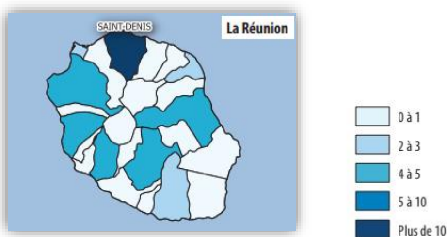
Figure 1. Nombre d'équipements culturels de proximité par territoire de vie à La Réunion « Note : les équipements culturels pris en compte pour cette carte sont les lieux de lecture publique d'une surface > 100 m 2 , les cinémas, les lieux de visite, les lieux de spectacle vivant et les conservatoires » (6)

À La Réunion, l'offre culturelle et artistique demeure faible comparée à celle de France métropolitaine (6). On compte, par exemple, sur toute l'île, 6 lieux publics d'exposition (musées de France, centres d'art contemporain et fonds régionaux d'art contemporain) contre une moyenne autour de 100 par région en France métropolitaine. Cette offre est inhomogène sur l'ensemble du territoire réunionnais (Figure 1).