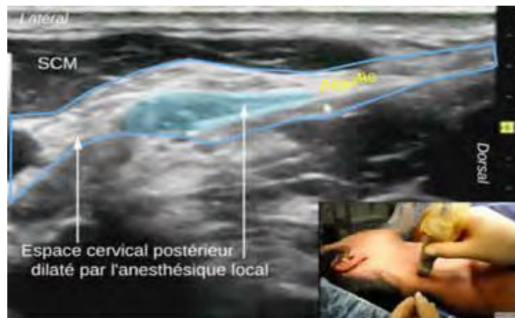
Figure 2. – Bloc intermédiaire du plexus cervical superficiel

Abord postérieur du plexus cervical superficiel. La ponction est réalisée au bord postérieur du muscle SCM.