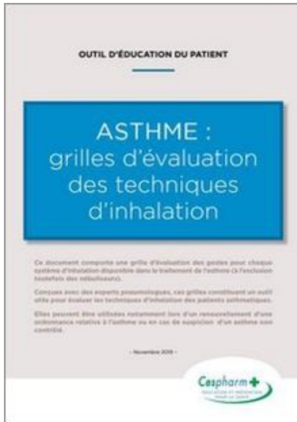
Figure 20 : Illustration des grilles d'évaluation des techniques d'évaluation du Cespharm