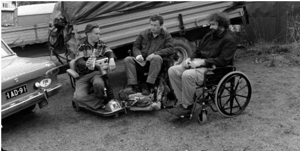
Aaltra , 2004

Individuellement, les deux auteurs ont su chacun apporter leur propre expérience du monde, leur propre sensibilité, dans les choix thématiques et structurels des scénarios. Mais c'est ensemble qu'ils se découvrent des problématiques communes, ce qui ajoute à l'œuvre une tout autre dimension. On le remarque dans cette trame qui guide les scénarios, qui pourrait se raconter par « la libération de quelqu'un grâce à l'amitié et à l'art ». 12 C'est ce qui guide le parcours des deux personnages d' Aaltra qui finissent par se lier, unis autour de Kaurismäki représentant cet art salvateur. Mais c'est surtout une manière d'envisager le parcours de vie de ces deux auteurs.