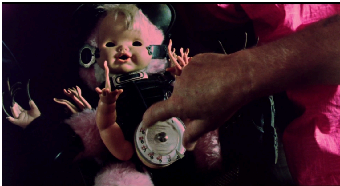
Mammuth , 2010 L'incongruité de l'objet

Nous pouvons apprécier dans Mammuth une représentation singulière de la création artistique à travers le personnage de Miss Ming et de ses œuvres brutes. Dans un premier temps, ces pièces paraissent être utilisées dans leurs aspects les plus provocants, les plus étranges, tel ce téléphone à tête de poupon qui aurait sa place dans un film d'épouvante. La séquence qui les introduit est filmée comme une exploration ; nous suivons Serge, de dos, entrer pour la première fois dans cette demeure. La caméra nous laisse apprécier les diverses et étranges décorations, sans qu'aucune explication ne permette d'établir la nature du lieu. La séquence atteint son pic d'étrangeté avec l'apparition de Miss Ming qui surgit dans le cadre, et qui fascine par son jeu lunaire. Une première séquence qui insiste sur l'étrangeté et l'incongruité de ces pièces qui démontrent d'une liberté créatrice totale, loin de tout conformisme. Le personnage de Miss Ming et ses créations contribuent à l'émancipation de Serge ; il s'agit de laisser exprimer son imagination et sa créativité, dans un geste spontané, authentique, pur. De cette manière, les deux auteurs démontrent d'un respect et d'une admiration pour ces artistes bruts, jusqu'à la dernière séquence qui met un terme au parcours de Serge.