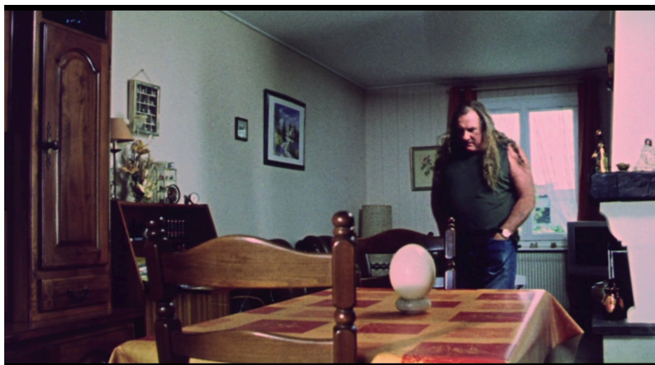
Mammuth , 2010

Nous l'avons vu, Delépine et Kervern apprécient les plans larges dans lesquels nous pouvons repérer l'acteur dans l'espace. Ces plans incitent un jeu davantage porté sur le corps plutôt que sur la voix : on peut ainsi plus apprécier sa corpulence, son poids, sa présence. Le plan qui nous présente Depardieu déambuler dans son salon au début de Mammuth fonctionne sur ce principe : le jeu est uniquement corporel, qui dévoile un mal-être par la posture, qui rappelle l'image d'un ours en cage. Depardieu fait le tour de la pièce qui semble trop étroite pour lui, les mains dans les poches, d'un pas vif, puis regarde par la fenêtre avec un mouvement de balancier qui dévoile une impatience. Son style, composé de longs cheveux détachés ainsi que d'un ensemble débardeur et jean, accentue une attitude détachée, nonchalante, négligée.