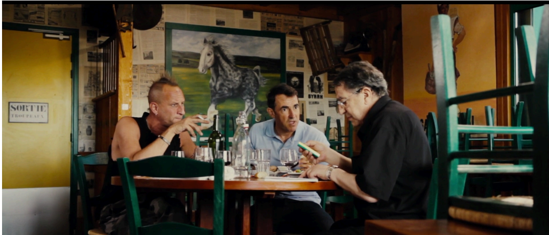
Le Grand Soir, 2012

Une discussion filmée en plan large où chacun parle simultanément