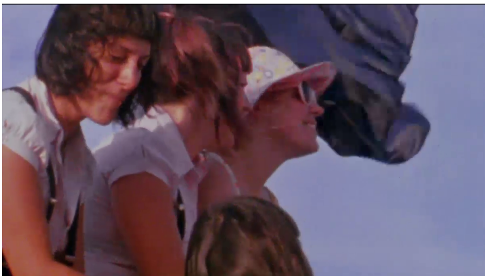
Mammuth , 2010

Certaines séquences ne sont ainsi dédiées ni à la critique, ni à la comédie, mais aux personnages ; Delépine et Kervern prennent le temps de les faire vivre. Mammuth est certainement le plus représentatif de cette démarche tant la manière même de filmer Depardieu engage l'empathie. Une séquence est particulièrement probante, lorsque Serge se laisse emmener par sa jeune nièce dans une fête. Ici, le film use d'un registre inhabituel et nous invite à entrer dans un état mélancolique. On y voit une jeunesse insouciante et vivante qui profite d'une après-midi de soleil pour l'amusement et le rire ensemble. Les plans larges et longs sont délaissés, tout comme le son direct, pour y substituer des plans plus serrés en caméra portée, au montage rythmé entrecoupé d'effets lumineux, porté une musique extradiégétique qui crée l'unité de la séquence et qui la rend si particulière au regard du film.