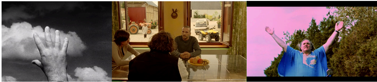
Avida , 2006, Louise-Michel , 2008, Mammuth , 2010

majoritairement filmé en 16mm noir et blanc, Avida en 35mm noir et blanc en 4/3, Louise-Michel en 35mm avec un étalonnage porté sur les tons marron.