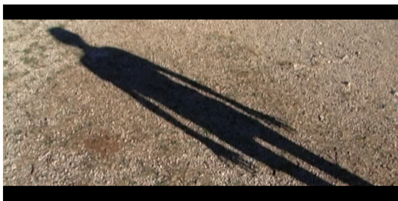
Near Death Experience , 2014 L'ombre d'un Houellebecq émacié

Le refus de tout effet esthétisant se ressent dans cette manière de montrer la vérité des corps : disgracieux, malhabiles, vieillissants. C'est bien ça aussi le corps ; un marqueur du temps qui passe. L'attitude révèle la vérité de l'acteur, de son âge à ses conditions physiques, à ses excès de toute part. Michel Houellebecq est fascinant à regarder dans Near Death Experience : on lit sur son corps une telle fatigue, une telle fragilité, qu'il en devient de facto pertinent à l'égard de ce qui nous est habituellement montré.