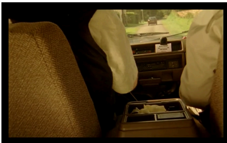
Louise-Michel (2008) Un décadrage accidentel

Dans ces moments, Delépine et Kervern souhaitent profiter de chaque élément qui les entoure. Ils sont alors dans un état d'esprit qui les amène à reconsidérer toute chose, à sentir les énergies et les multiples possibilités, dans une attitude d'ouverture et de bienveillance. Pour se définir, Delépine use le terme de « plaque sensible » ; ce n'est pas seulement qu'ils guettent les éventualités, mais c'est qu'ils entrent dans une réceptivité où chaque chose peut être source d'émotions. Delépine utilise aussi la formule « être à l'affût » 21 ; il y a cette idée que chaque chose puisse être profitable, que tout élément puisse s'intégrer dans le film selon l'inspiration du moment. De cette recherche résulte un cinéma plus spontané, où l'accent est mis sur les sensations et l'expérience du réel. Les premiers plans de Mammuth font ainsi voir le défilement d'un paysage, comme annonciateur du voyage qui va suivre ; des images prises à la volée, non prévues mais insérées au montage – elles ont été filmé par Fred Poulet pour son Making fuck-off qui retrace le tournage du film. Pour Delépine, c'est bien cette attitude qui les a poussés à la rencontre de Miss Ming lors du tournage d' Avida , devenue régulière dans leur cinéma. Elle déclamait des poèmes sur la plage, se rendant de fait extraordinaire aux oreilles de ces réalisateurs, si prompts à cueillir le singulier.