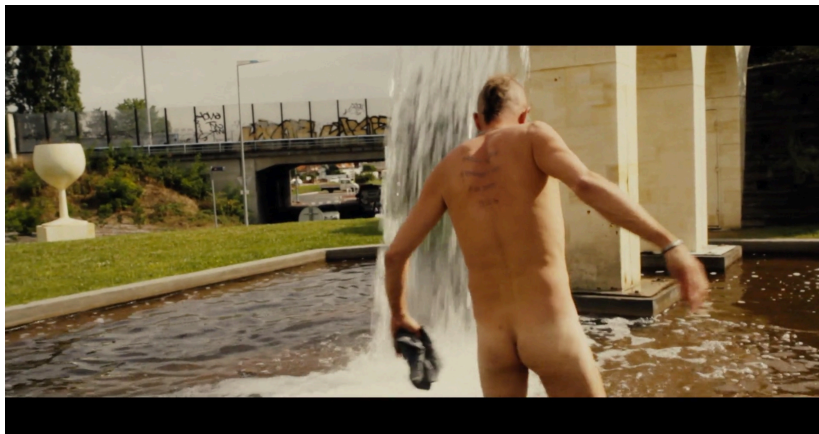
Le Grand Soir , 2012 La nudité et Poelvoorde

Les corps sont ainsi montrés dans leurs instants les plus insignifiants, les plus triviaux et donc les moins soignés, les moins mis en valeur. Delépine et Kervern prennent ici l'outil cinéma pour amener à voir ce qui est d'habitude plutôt caché ou maquillé, et c'est cet effet de réel qui paraît étrange. Au cinéma, nous ne sommes pas habitués à voir des comédiens aussi volontaires, autant à l'aise avec leur corps. Après une séquence du Grand Soir , Poelvoorde a avoué ne pas avoir joué nu depuis C'est arrivé près de chez vous , pour dire à quel point Delépine et Kervern parviennent à instaurer un climat de confiance avec leurs acteurs.