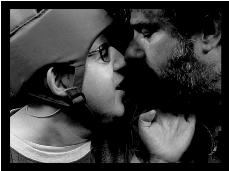
Avida , 2005

La proximité physique entre Kervern et l'acteur handicapé raconte la proximité du réalisateur envers la marginalité