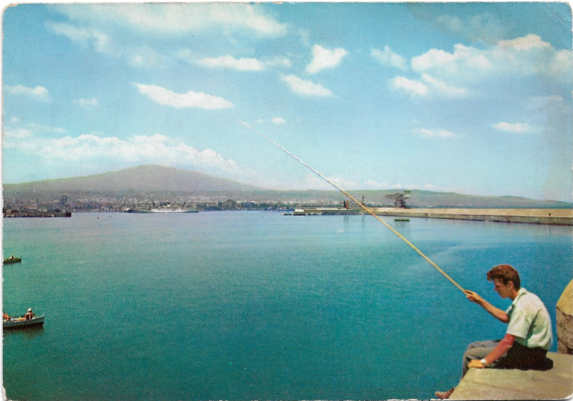
CATANIA – Le port : carte postale des années 1960, Catania, il porto , Edizione S.Vitro, Catania