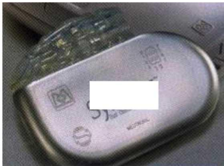
Figure 9 :Neurostimulateur