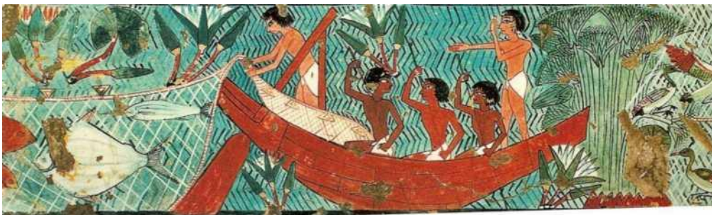
Figure 2 :Pêche sur le Nil