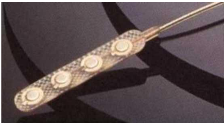
Figure 8 :Electrode Resume

Les extensions des électrodes sont ensuite tunnélisées et connectées à un générateur (figure 9) placé dans la région sous claviculaire ou latéro-thoracique . Les réglages sont empiriques et basés sur l'expérience. Les paramètres statistiquement utilisés sont : amplitude 2 volts (1 à 4 V), fréquence 40Hz (25 à 55Hz), largeur d'onde 120 microsec (60 à 180 microsec) . Il est important que le contact négatif (cathode) soit sur le cortex moteur en regard du territoire cible.