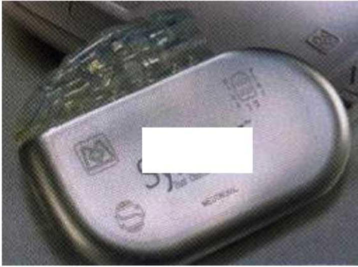
Figure 9 :Neurostimulateur