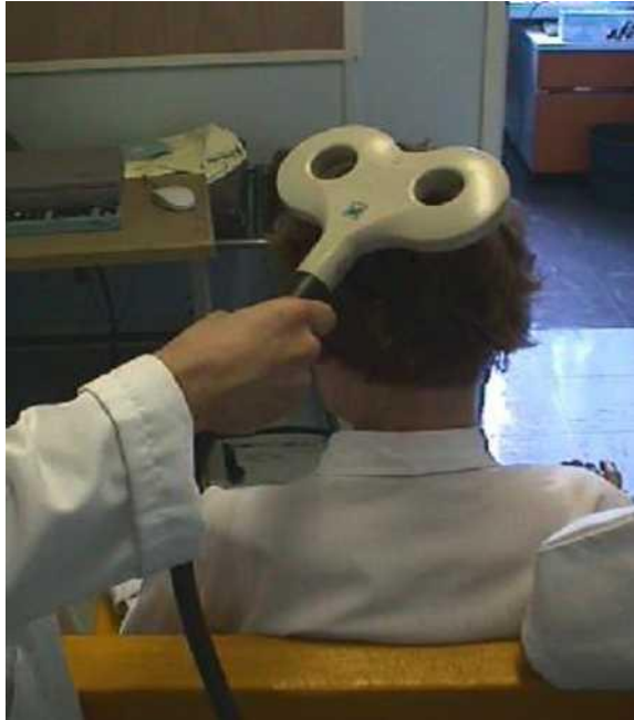
Figure 6: Stimulation magnétique transcranienne

rTMS(figure 6), l'implantation d'une stimulation corticale était proposée au patient.