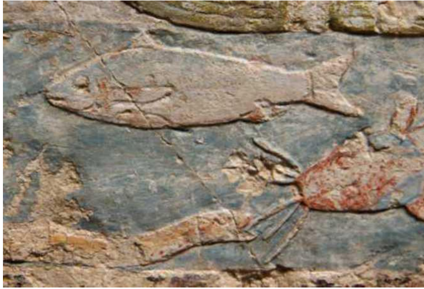
Figure 3 :Poisson chat (en bas à droite) et anguille( en bas à gauche)