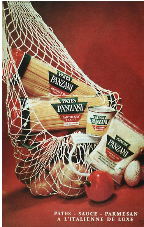
Illustration : Publicité de Panzani des années 1960