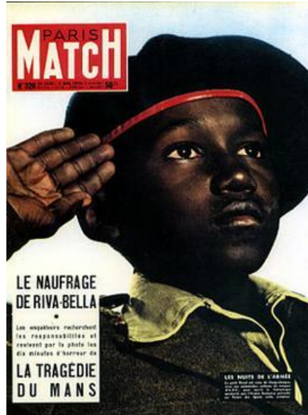
Illustration : Couverture d'un numéro de l'édition française du magazine Paris Match que Barthes analyse