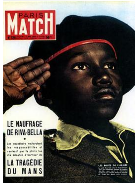
Illustration : Couverture d'un numéro de l'édition française du magazine Paris Match que Barthes analyse

Source : Wikipédia, Paris Match - child soldier cover , Mythologies [En ligne].