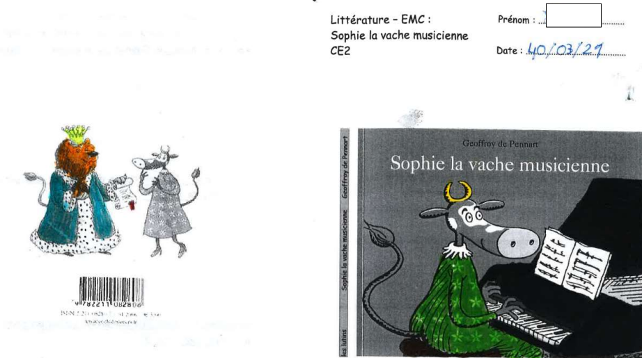
Figure 1: Première et dernière page de couverture du livret des élèves