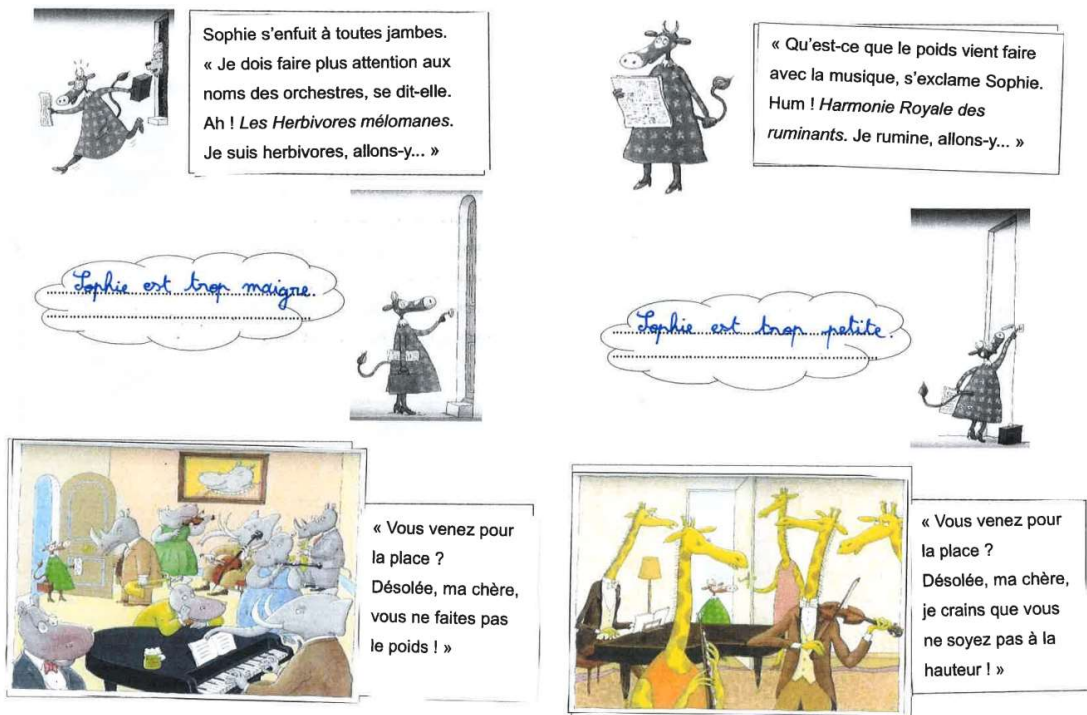
Figure 5: Travail de reconstitution de l'histoire, puis analyse des critères d'exclusion