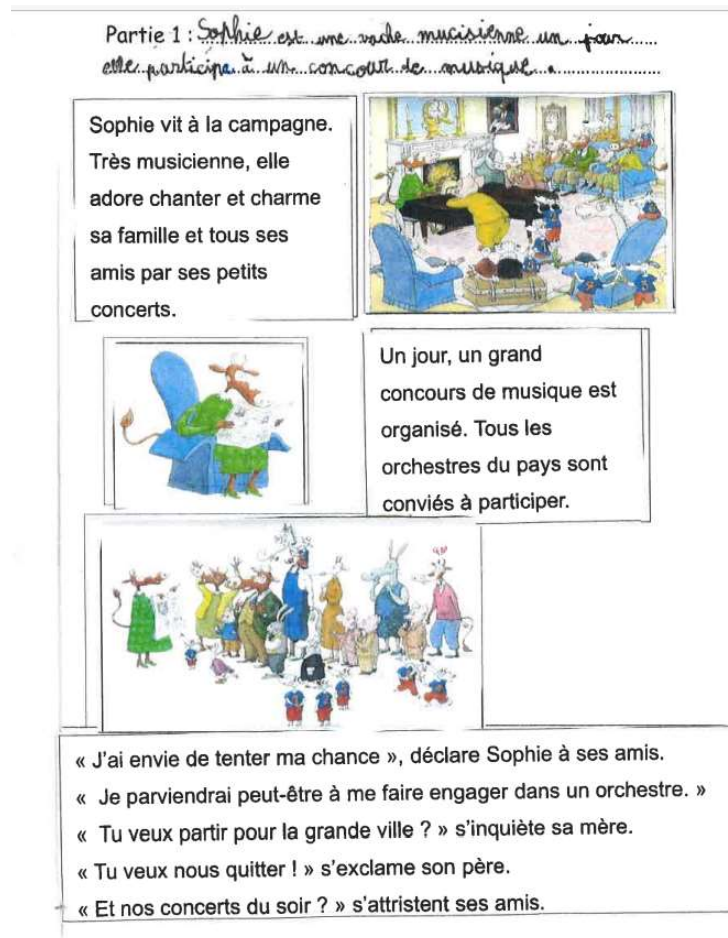
Figure 4: Début de l'histoire et travail de résumé