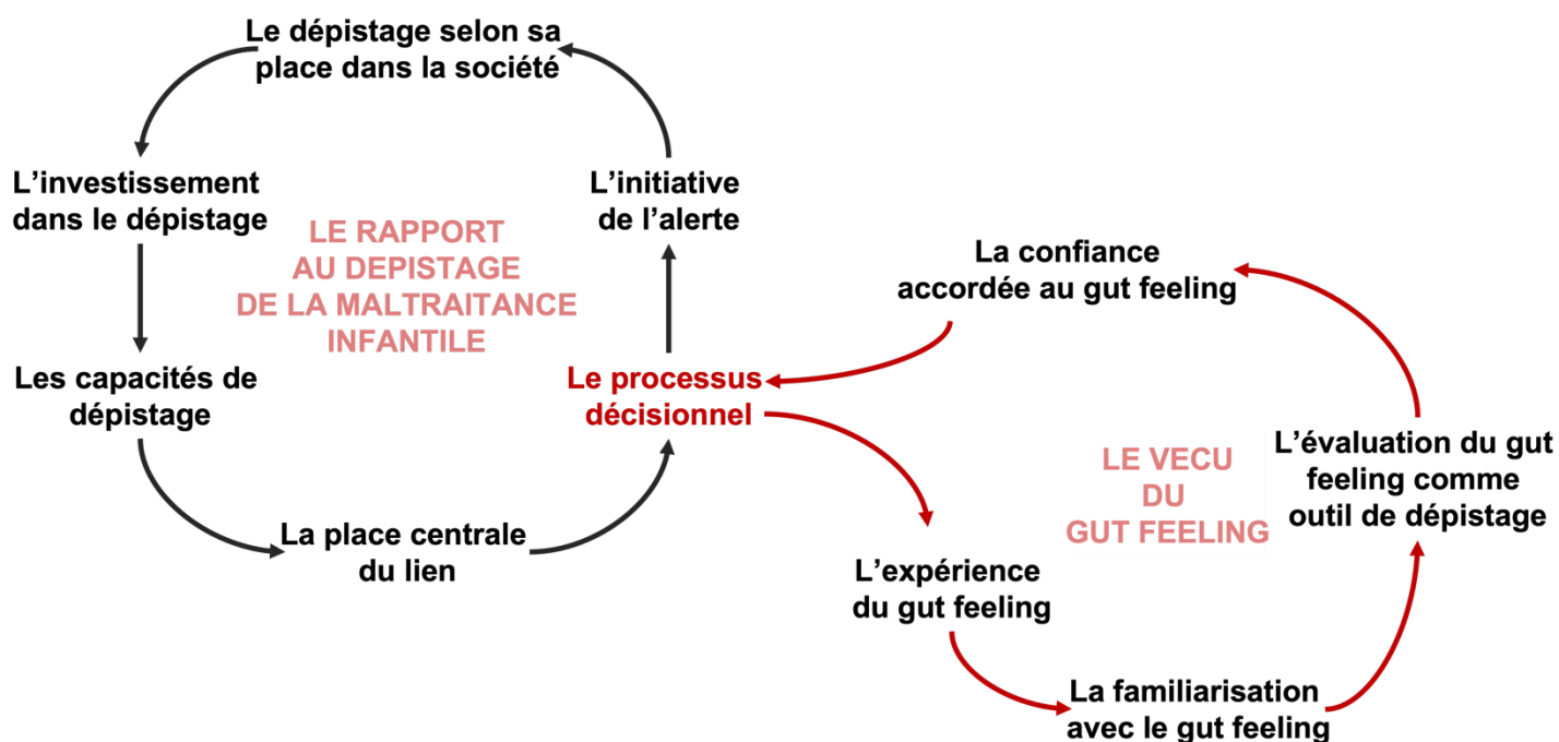
Figure 2. Le gut feeling comme élément du processus décisionnel dans le dépistage de la maltraitance infantile

Ces thèmes super-ordonnés peuvent être présentés en deux ensembles : le rapport au dépistage de la maltraitance infantile et le vécu du gut feeling. Ce dernier ensemble participe à la compréhension du processus décisionnel quant à l'initiative de l'alerte dans la maltraitance infantile (Figure 2).