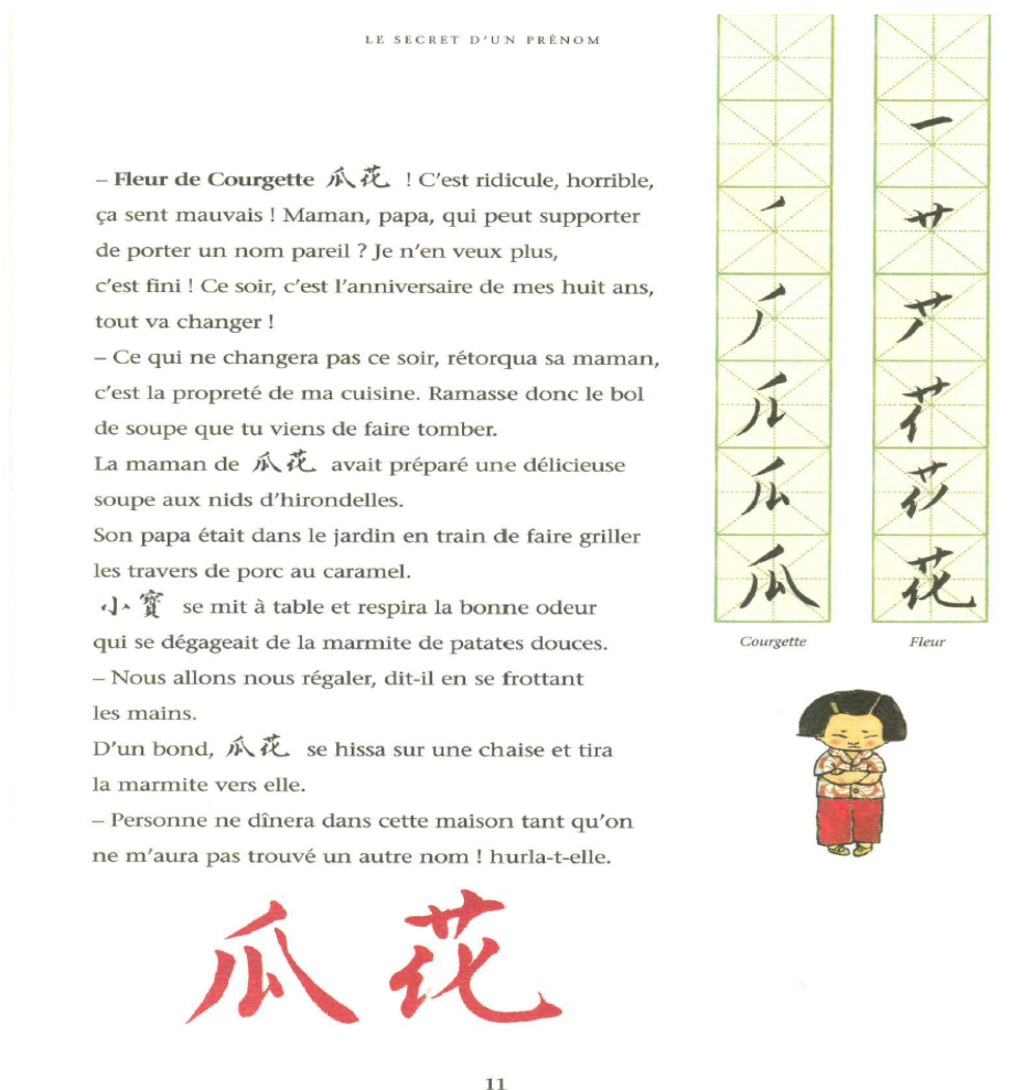
Figure 5 : un extrait de l'album le secret d'un prénom chinois (Bresner, 2003 : 11)

idéogramme. Nous pourrions par la suite inventer notre propre prénom en associant plusieurs idéogrammes. A la fin, un texte explique le fonctionnement des prénoms chinois, ce que sont les idéogrammes en comparaison de notre alphabet. On y décrit aussi la prononciation de différents phonèmes avec l'explication des tons de voix. La calligraphie y est présentée comme un art « aussi important que la peinture ». On apprend aussi que le pinceau sert aussi bien à la peinture qu'à l'écriture ce qui permet encore une fois de prendre de la distance par rapport à la langue, montrant ici que toutes les écritures n'ont pas la même valeur à travers le monde.