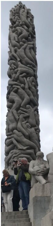
Figure 6 : extrait de l'œuvre de Sarah Zay qui a inspiré l'arbre polyglotte

Dans le même état d'esprit, on peut citer l'arbre polyglotte (Maire-Sandoz, 2008). « Sous le préau couvert de l'école a poussé un arbre polyglotte. Sculpture inspirée d'une œuvre de la plasticienne américaine Sarah Zay, un serpent in de mousse monte, du sol au plafond, en spirale décroissante. Tout le long, chacun des cent douze élèves y a planté sa tige de bambou parée d'une fleur et d'un fruit. Les pétales colorés représentent les langues parlées, comprises, entendues, vues écrites ; les fruits oblongs sont calligraphiés de mots choisis et traduits en différentes langues ».