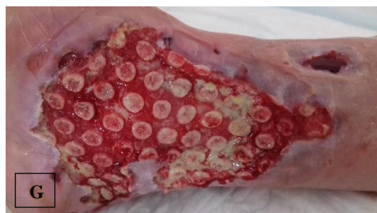
pa.4 á NPWTi-d (F), ḡ NPWTi-d (G)