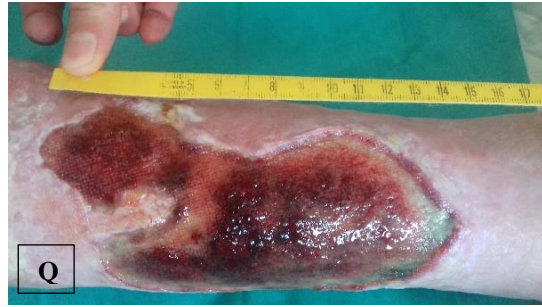
pa.9 á NPWTi-d (P), \bar{p} NPWTi-d (Q)