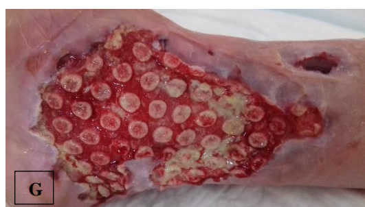
pa.4 á NPWTi-d (F), ḡ NPWTi-d (G)