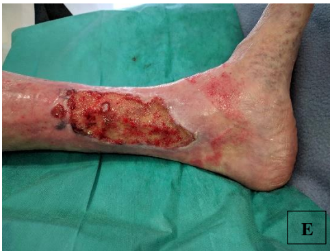
pa.3 ḡ NPWTi-d (E)