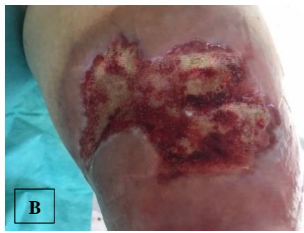
patient (pa.) 1 before (á) NPWTi-d (A), after (ḡ) NPWTi-d (B)