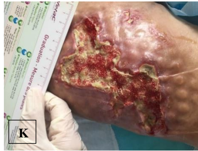
pa.6 á NPWTi-d (J), \bar{p} NPWTi-d (K)