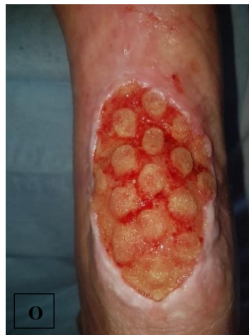
pa.8 á NPWTi-d (N), \bar{p} NPWTi-d (O)