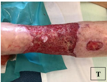
pa.12 \bar{p} NPWTi-d (T)