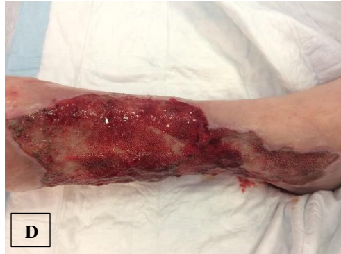
pa.2 á NPWTi-d (C), ḡ NPWTi-d (D)