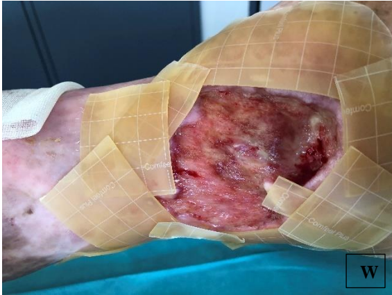
pa.14 á NPWTi-d (W)