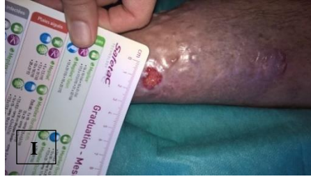
pa.5 á NPWTi-d (H), \bar{p} NPWTi-d (I)