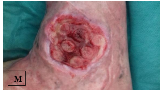
pa.7 á NPWTi-d (L), \bar{p} NPWTi-d (M)