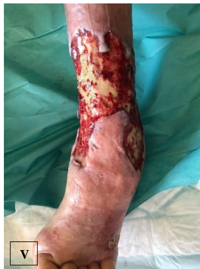
pa.13 á NPWTi-d (U), \bar{p} NPWTi-d (V)