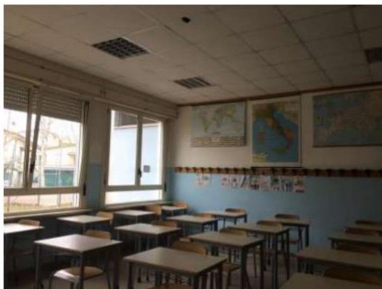
Photo 2 : la salle de classe, les bureaux individuels et espacés, le micro au plafond pour que les élèves de l'aula Z puissent entendre leurs camarades