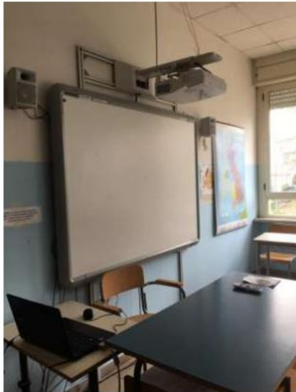
Photo 1 : le bureau de l'enseignante, entre le TBI et l'ordinateur, connecté avec l'aula Z