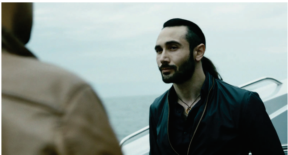
Illustration 4 - Photographie de Don Conte, personnage du film Gomorra