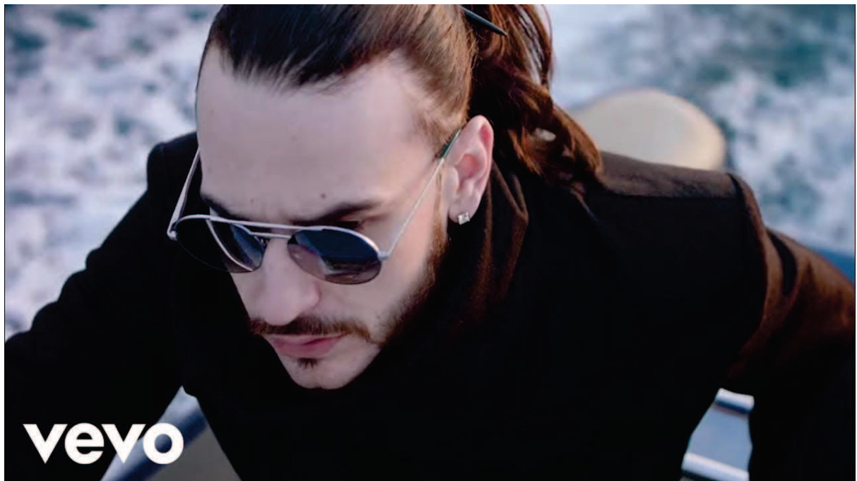
Illustration 3 - Photographie du rappeur SCH, extraite du clip Comme Si