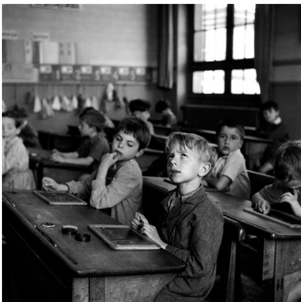
Salle de classe (Paris, 1956), Robert Doisneau

De l'ardoise à la tablette, des outils innovants pour une classe inchangée