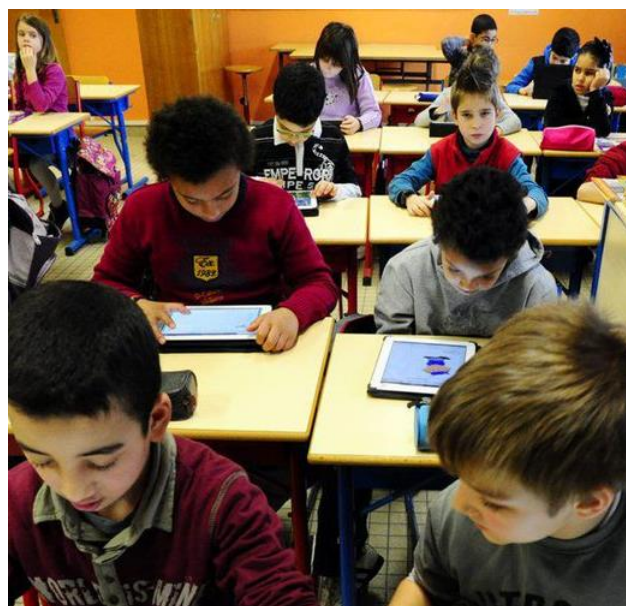
Une salle de classe à Agen, 2013