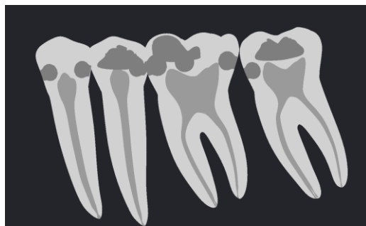
Figure 6: Exemple de simulation radiographique correspondant au secteur 3