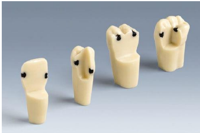
Figure 2: Dents Frasaco® présentant des lésions carieuses

Les systèmes physiques reproduisant des dents comprennent également les dents en résine comme celles de Frasaco® présentant des lésions carieuses avec (fig.3) ou sans (fig.2) morphologie interne (chambre et canaux pulpaires). Cependant, l'absence de différence de texture entre les tissus sains et les tissus cariés rend le curetage avec excavateur et contre-angle impossible sur ces modèles, ce qui modifie l'enjeu de l'entraînement et de l'évaluation lors des étapes précliniques.