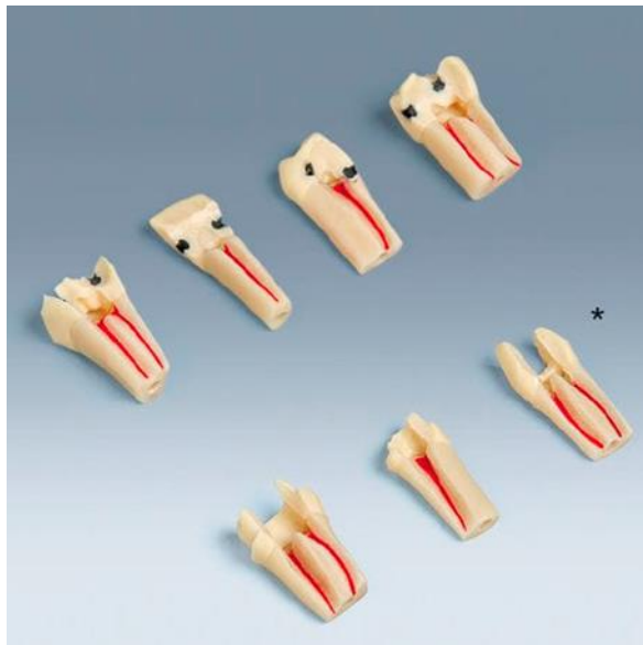
Figure 3: Dents Frasaco® pour exercice d'endodontie.