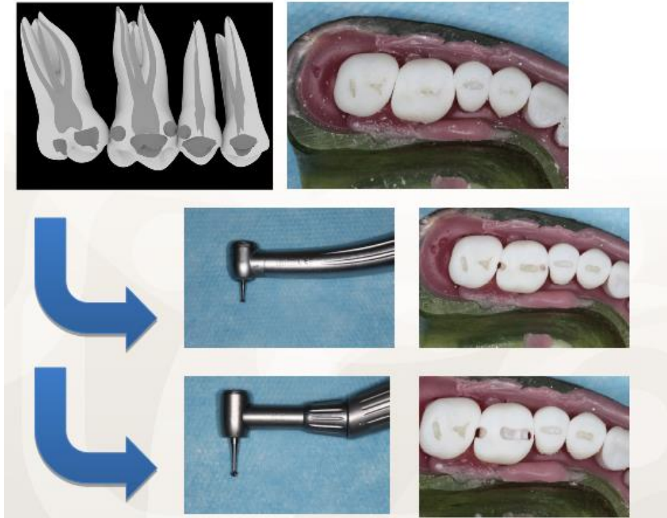
Figure 7 : Photographies illustrant les étapes d'ouverture, de curetage et d'aménagement cavitaire des dents du secteur 1.

De plus, des photographies (fig.7) illustrant les différentes étapes du traitement ont été proposées afin de permettre aux étudiants faire le lien entre les notions théoriques et la mise en application pratique. Elles offrent ainsi une vision concrète de ce que l'on attend des étudiants.