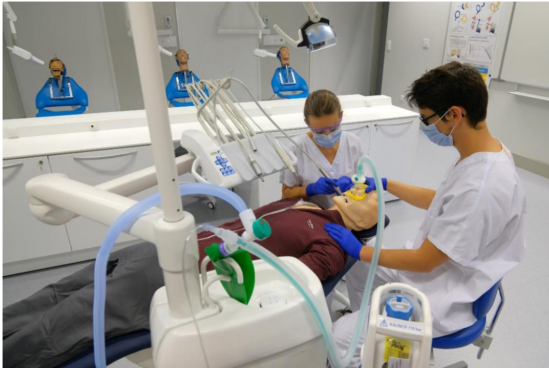
Figure 1: Mannequin-robot interactif à la faculté de chirurgie-dentaire de Strasbourg

Les systèmes virtuels sont des systèmes informatiques dont le développement est aujourd'hui meilleur 6 mais leur coût reste encore important. On retrouve par exemple le Simodont ( www.simodont.org ), le Virtual Reality Dental Training system (VRDTS) 14 ou le Individual Dental Education Assistant (IDEA Dental) 7 .