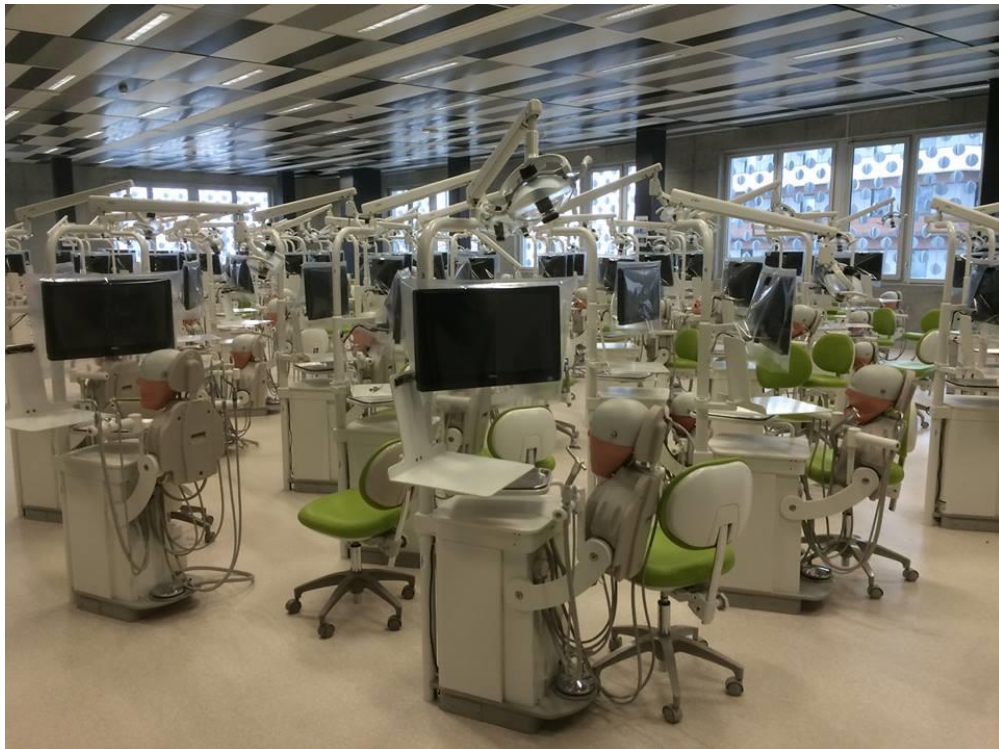
Figure 5: Salle de TP Fantômes - Faculté de chirurgie-dentaire de Clermont-Ferrand

Le semestre comportait 12 séances de TP qui se sont déroulés dans la salle de TP Fantômes ou salle de simulation (fig. 5).