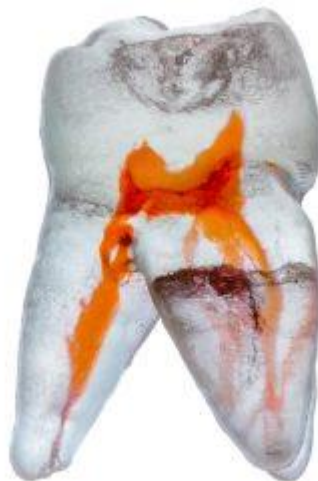
Figure 8: Simulateur TrueTooth®

Rappelons que le simulateur Cre@teeth a été entièrement modélisé par ordinateur. D'autres méthodes de modélisation existent avec notamment le recours à la stéréolithographie qui permet de reproduire des dents complètes à partir d'images scannographiques (fig. 8).