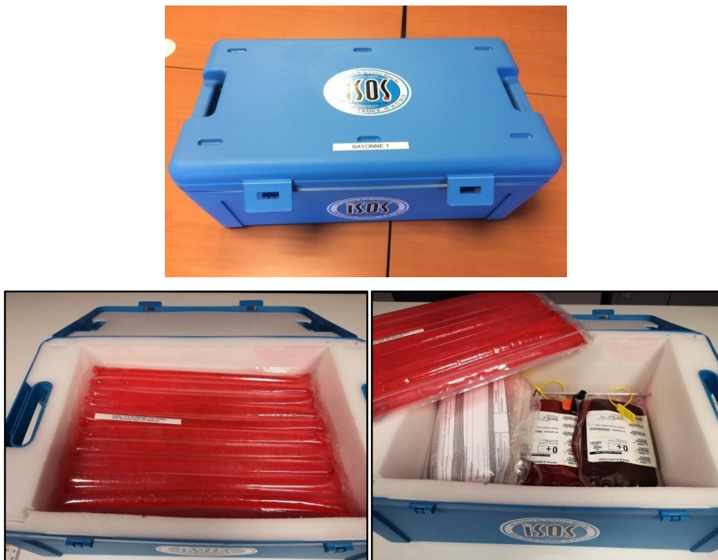
Figure 2 – Pack transfusionnel 1

Un troisième pack transfusionnel peut être utilisé selon l'état du patient. Il est demandé par le réanimateur de garde via le médecin régulateur pour anticiper la prescription de PSL avant l'arrivée du patient. Il est à usage intra-hospitalier.