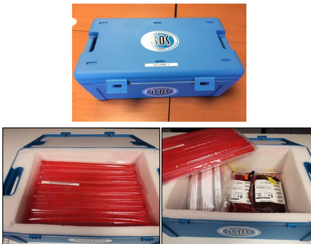
Figure 2 – Pack transfusionnel 1

Un troisième pack transfusionnel peut être utilisé selon l'état du patient. Il est demandé par le réanimateur de garde via le médecin régulateur pour anticiper la prescription de PSL avant l'arrivée du patient. Il est à usage intra-hospitalier.