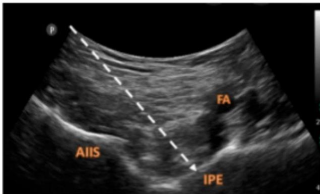
Fig 1B: PENG Block Needle trajectory and psoas tendon

FA (Femoral artery), IPE (Ilio Pubic Eminence), AIIS (Anterior Inferior Iliac Spine)