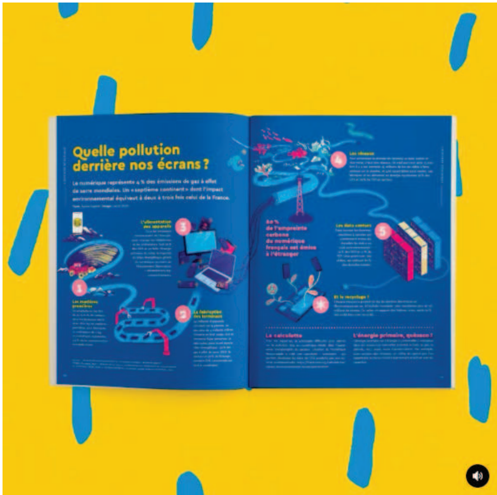
Source : © Chut_magazine, visuel extrait de Chut! n°4, L'Odysée écologique, illustration Laure Dorin.

Typiquement, sur ce type d'illustration (ci-dessus), il y a une volonté de s'inscrire dans la continuité du texte, voire même d'en épouser la forme au sens propre. L'illustration propose un cheminement et devient le support de la lecture, elle guide le regard. Elle apporte des informations supplémentaires en permettant au lecteur d'identifier d'un coup d'œil à quelle notion se réfère tel ou tel paragraphe.