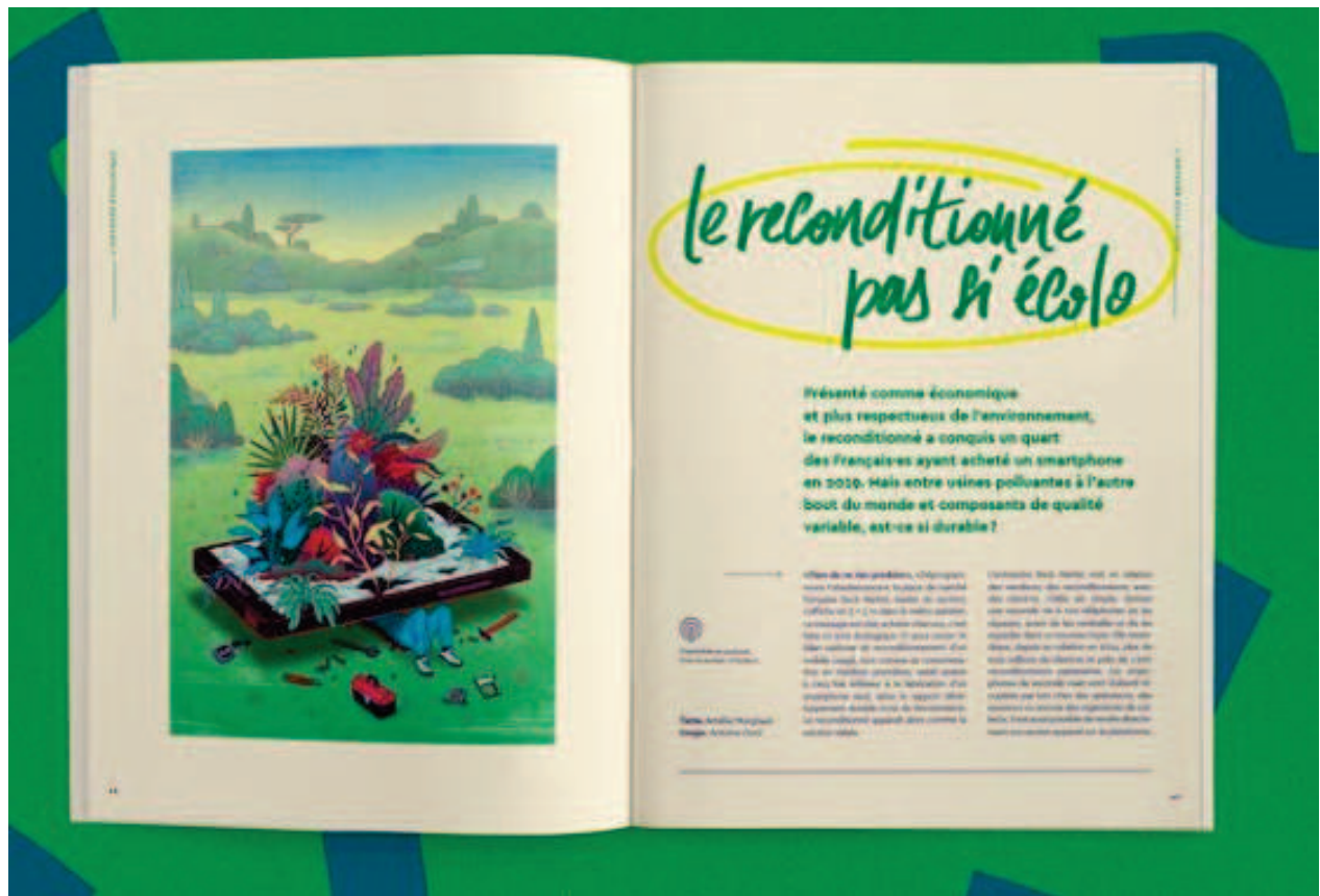
visuel extrait de Chut! n°4, l'Odyssee écologique, illustration Antoine Doré.

échelle a été volontairement modifiée, de telle sorte que le smartphone semble finalement s'apparenter à un véhicule qu'un mécanicien prend le soin de réparer.