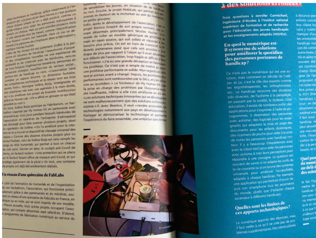
visuel extrait de Chut! n°5, Liberté, égalité, santé.