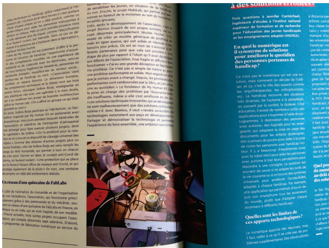
visuel extrait de Chut! n°5, Liberté, égalité, santé.