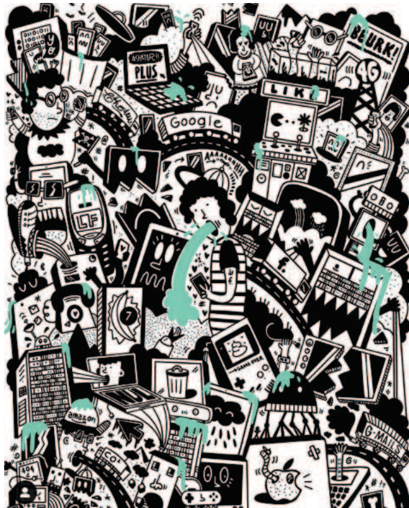
Source : © Chut_magazine, visuel extrait de Chut! n°1, La Femme, l'avenir de la tech, , illustration Paul Delmas.

Une assertion qui se vérifie dans le cadre de Chut! , puisque de nombreuses illustrations s'éloignent du champ du texte, ne se rattachant à celui-ci que par un ou plusieurs petits détails. C'est le cas, par exemple, de l'illustration de Paul Delmas (ci-dessous). Intégrée dans le premier numéro du magazine, en parallèle d'un article sur la pollution numérique, l'illustration porte en effet en elle-même un discours complet et une histoire. Elle incite le lecteur à lire chacun d'eux pour comprendre son sens. Une lecture, qui se fait avant même celle de l'article en lui-même puisque dans Chut! , la maquette est organisée de telle sorte qu'une illustration en pleine page est proposée en amont de l'article auquel elle est rattachée.