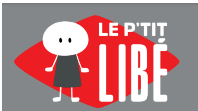
Capture d'écran du personnage du P'tit Libé sur le site du journal.