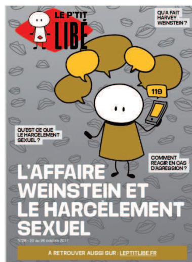
Couverture du n°28 du P'tit Libé sur l'affaire Weinstein (20 au 26 octobre 2017).

Il faut se mettre à la place de l'enfant et se demander quelles questions il pourrait se poser sur ce sujet. Dans le dossier sur l'affaire Weinstein du P'tit Libé , des questions sont posées « en vrac » dès la page de couverture : « Qu'est-ce que le harcèlement sexuel ? Comment réagir en cas d'agression ? Qu'a fait Harvey Weinstein 42 ? » Le sujet des violences faites aux femmes recouvre souvent beaucoup de questions qui paraissent logiques pour les adultes mais qui ne le sont pas forcément pour les enfants. De même, le choix graphique de cette édition amplifie encore cette idée : la multitude de bulles dessinées sur la couverture montre que ce genre de sujets peut susciter beaucoup de questionnements et donc mérite beaucoup d'explications.