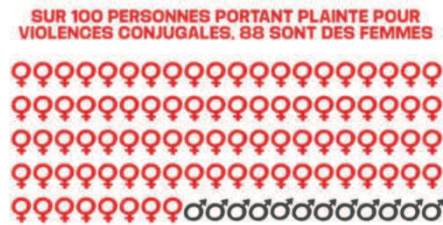
Capture d'écran du n°144 du P'tit Libé sur les violences conjugales (6 au 12 mars 2020).

compréhensible. Dans le numéro du P'tit Libé sur les violences conjugales, le chiffre est accompagné d'une illustration graphique pour être plus lisible (« Sur 100 personnes portant plainte pour violences conjugales, 88 sont des femmes 39 »).