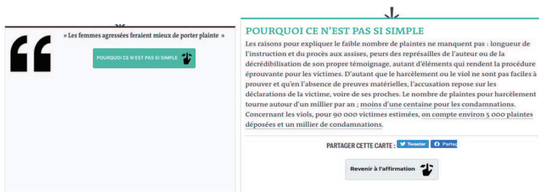
Capture d'écran du petit manuel pour lutter contre les idées simplistes sur le harcèlement sexuel

A ce sujet, le troisième article analysé est particulièrement éclairant. Il propose au lecteur plusieurs cartes avec à chaque fois une affirmation pouvant apparaître trivial mais qui est souvent répandue dans la société. Un exemple : « Les femmes agressées feraient mieux de porter plainte ». Pour chaque citation, un petit encadré « Pourquoi ce n'est pas si simple » ou « Faux » est proposé. Dans le cas que nous venons de donner, Le Monde explique par exemple que de nombreuses raisons peuvent expliquer le manque de plaintes, comme la « longueur de l'instruction », « la peur de représailles », ou encore de la « décrédibilisations de son propre témoignage ». Ce format, encore plus que les précédents, permet de remettre en cause les idées reçues. En effet, il utilise une citation stéréotypée pour mieux la déconstruire par la suite, donnant ainsi au lecteur un aperçu plus juste de ce qu'est le harcèlement sexuel.