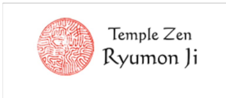
Le logo du Temple Zen Ryumon Ji

Le Temple Zen Ryumon Ji est un monastère qui a été fondé en 1999 par le maître Reigen Wang-Genh grâce aux pratiquants d'Alsace et d'Allemagne du sud qui ont apporté leur aide et fait des dons pour la création de ce site. Le nom de ce temple signifie « temple de la Porte du Dragon de la vieille montagne » car il se trouve à proximité d'une colline, appelée « vieille montagne » en alsacien, et à proximité d'une forêt à 50 km au nord de Strasbourg. Ce monastère accueille des moines, des nonnes et des laïcs qui se « sont installés pour vivre une vie monastique selon les règles de l'école Zen sôtô » (Temple Zen Ryumon Ji, s.d.).