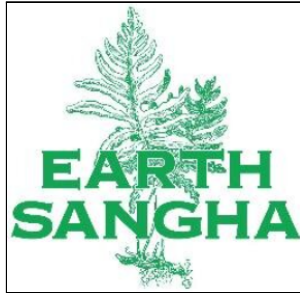
Le logo d'Earth Sangha