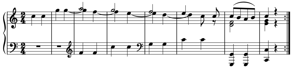
Fig.2 : Extrait de la variation n°9 dans MOZART, W.A., Thème et variation sur « Ah vous dirai-je maman », K.265.

mesure de rattacher cela à la notion de canon que nous avons étudié dans une précédente séquence. J'ai pu alors leur expliquer que le canon était justement une forme d'imitation, la plus stricte qui soit. Nous retrouvons donc ce fonctionnement chez Mozart :