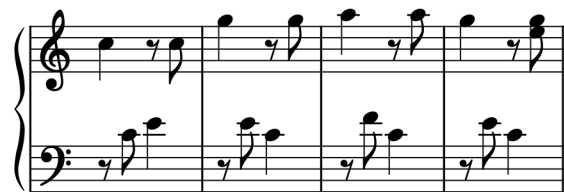
Fig.1 : Extrait de la variation n°5 dans MOZART, W.A., Thème et variation sur « Ah vous dirai-je maman », K.265.

question courte au second élève qui devait alors lui donner une réponse succincte. Les deux élèves devaient réitérer cet échange deux ou trois fois. Des questions et réponses simples ont pu ressortir comme « - Comment vas-tu ? – je vais bien ». Nous avons ensuite analysé le phénomène avec la classe. Il a pu en ressortir que chaque proposition était brève, qu'il y avait une régularité qui s'installait et que chaque protagoniste recevait la parole tour à tour. Et c'est exactement ce qui se passe chez Mozart :