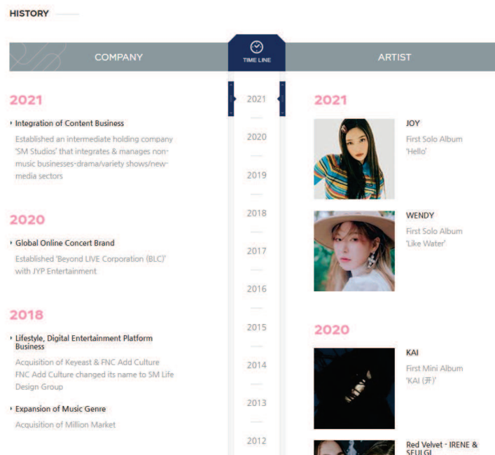
Figure 1 : frise chronologique mettant en parallèle l'histoire institutionnelle et marketing de SM Entertainment (capture d'écran du site corporate du label) 50

Le cas de SM Entertainment est révélateur du caractère central de la temporalité dans les discours corporate des entreprises de divertissement musical. Sur son site corporate, le label matérialise son histoire dans une frise chronologique. Celle-ci met en regard deux pans de la croissance de SM Entertainment : les étapes de son développement institutionnel (à partir des années 2010) et les dates clefs de ses productions culturelles (dès les années 1990).