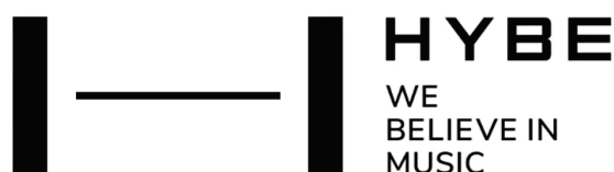
Figure 3 : éléments graphiques du logo de Hybe Corporation 60