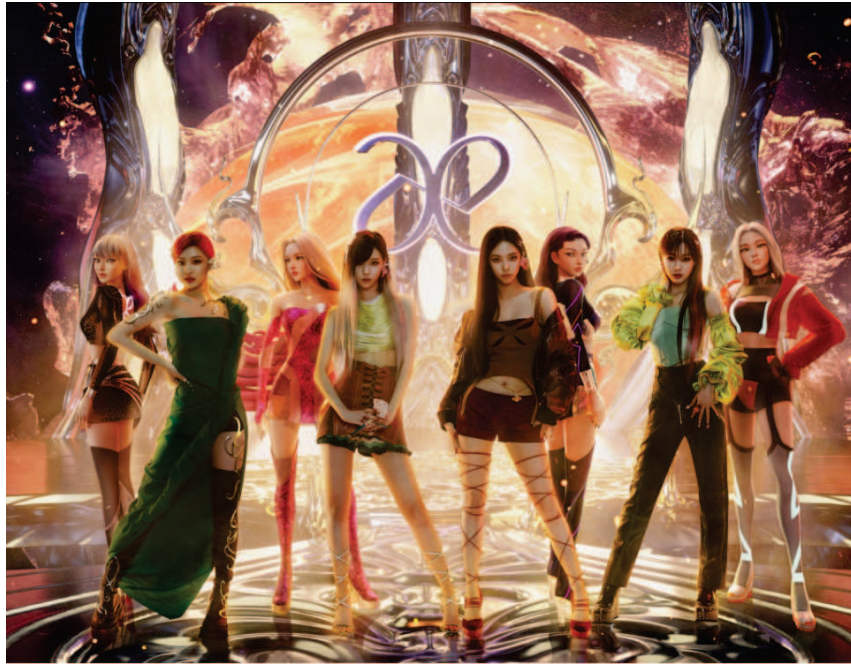
Figure 2 : le groupe Aespa de SM Entertainment, composé de 4 artistes et de leurs avatars virtuels respectifs. 52

La communication articule donc un passé de performance et une vision du futur, tous deux liés par une valeur centrale des entreprises de divertissement musical coréennes : l'innovation. SM Entertainment aime à rappeler le caractère novateur du modèle dont elle est à l'origine : « SM Entertainment (...) est la première entreprise de l'industrie à introduire un système de casting, formation, production et management systématique. » Le groupe est présenté comme l'avant-garde à l'origine d'un modèle industriel nouveau ayant participé au développement de l'industrie musicale coréenne et de l'économie nationale dans son ensemble. L'innovation intervient en tant que valeur corporate centrale et se retrouve dans la communication à travers l'expression de la découverte d'un business model (« les technologies culturelles de pointe »). Ainsi, les entreprises de K-pop se disent-elles tournées vers l'avenir, à la pointe des tendances. Elles affirment leur ancrage dans la société contemporaine dont elles suivent, voire stimulent l'évolution. Le modèle de la K-pop était déjà innovant à sa naissance dans les années 1990 et les labels continuent d'accompagner et de penser de nouvelles formes de production et consommation musicale. La stratégie marketing tire profit du développement du digital, tout comme les produits musicaux eux-mêmes parviennent à refléter l'évolution de la société coréenne au sein de son environnement international