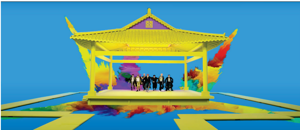
Figure 4 : clip de la chanson « Idol » de BTS. 67

la suite, la K-pop étant un élément médiateur de l'image nationale, les groupes de divertissement musical prêtent attention à présenter la culture du pays de manière favorable et stratégique. Ces entreprises étant présentes dans divers secteurs d'activité, la promotion de la culture coréenne sert leur propre valorisation. Ainsi, on retrouve dans les clips vidéos, les visuels et les mélodies de K-pop, des éléments structurants de la culture coréenne : le « K » de K-pop est bien une manière d'étiqueter ces produits comme coréens. Par exemple, l'image de marque élaborée par le gouvernement coréen insiste sur le caractère moderne et innovant du pays. Nous l'avons vu, la communication corporate des entreprises de K-pop les valorise comme précurseurs d'un modèle industriel innovant. De même, les clips vidéos font souvent figurer des éléments presque futuristes comme le groupe Aespa que nous avons évoqué pour l'utilisation d'avatars en intelligence artificielle. Trait caractéristique coréen, le dialogue entre tradition et modernité est également présent dans les supports de K-pop : le clip de la chanson « Idol » de BTS met en scène les 7 chanteurs en hanboks (vêtement traditionnel coréen) au sein d'un temple traditionnel, dans un univers résolument moderne (cf figure 4).