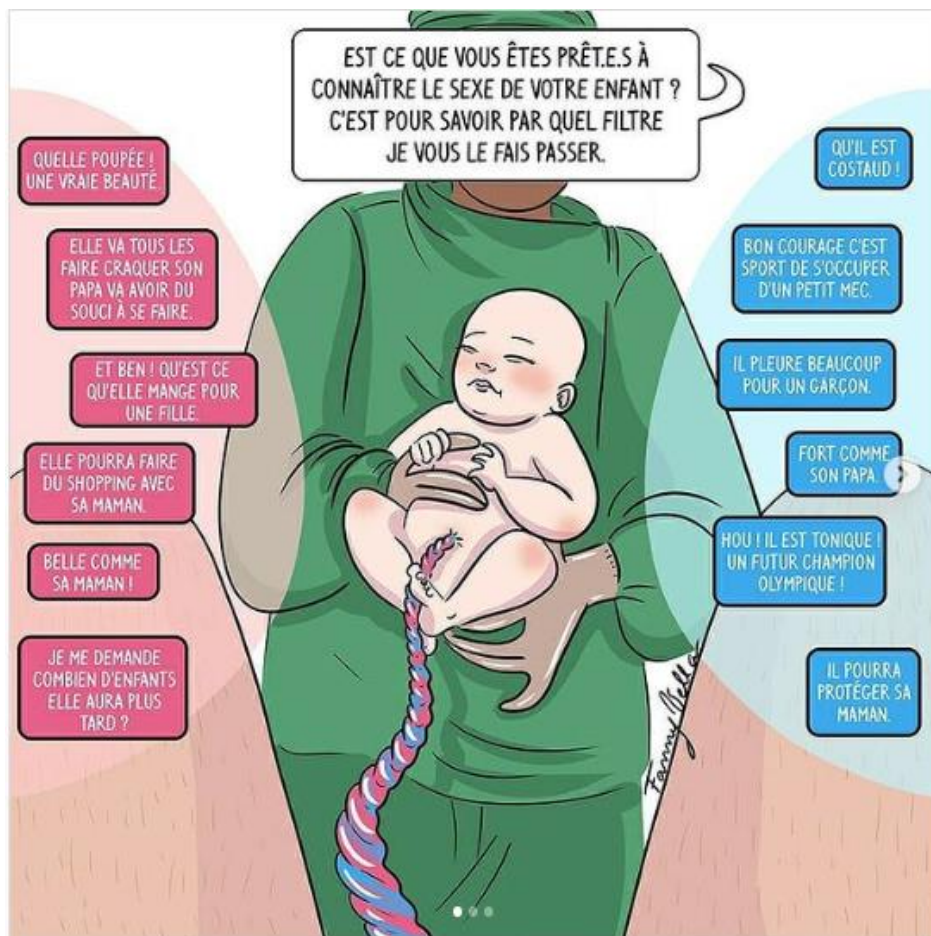
Figure 1 : Illustration des stéréotypes de genre par l'artiste Fanny Vella.

Une illustration de l'artiste/dessinatrice Fanny Vella représente bien cette idée :