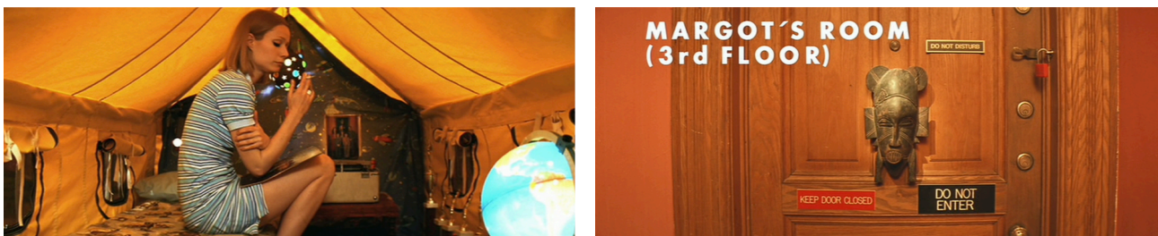
Captures d'écran, La Famille Tenenbaum , Wes Anderson, 2002.

Pour autant, les décors intérieurs se sont pas toujours révélateurs des personnages s'ils ne sont pas travaillés et pensés en amont. Tous les films n'ont pas un décor aussi emblématique que chez Wes ANDERSON et la maison de la famille Tenenbaum dans laquelle chaque personnage dispose de son propre espace bien défini, leur chambre, qui les représente de façon directe avec des couleurs choisies pour eux. La maison est un véritable espace fragmenté, délimité par des portes, qui révèle la fracture familiale que vivent les personnages 75 .