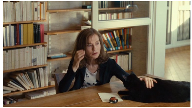
La bibliothèque avant et après la séparation, L'avenir , Mia Hansen-Løve, 2016.