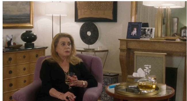
Captures d'écran, La Vérité , Kore-Eda, 2019, 1h46.