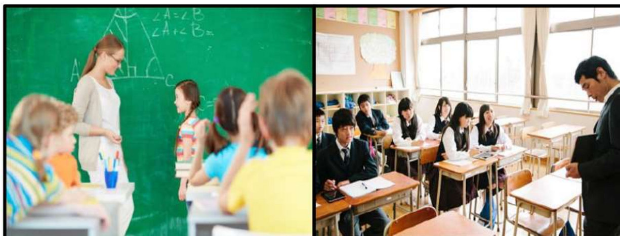
PROFESSEUR.E DES ÉCOLES