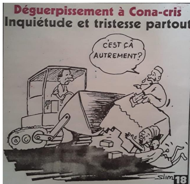
Figure 3 : Journal de la presse écrite traitant le sujet des déguerpissements. Ce journal issu d'un media local Le lynx, reprend le slogan du président Alpha Condé lors des élections, « Gouverner autrement »

Nous voilà arrivé à la troisième partie consacrée à notre terrain d'études. Dans cette partie, nous traitons le sujet des déguerpissements à une échelle locale au regard de la politique globale de l'Etat guinéen en matière de politique foncière.