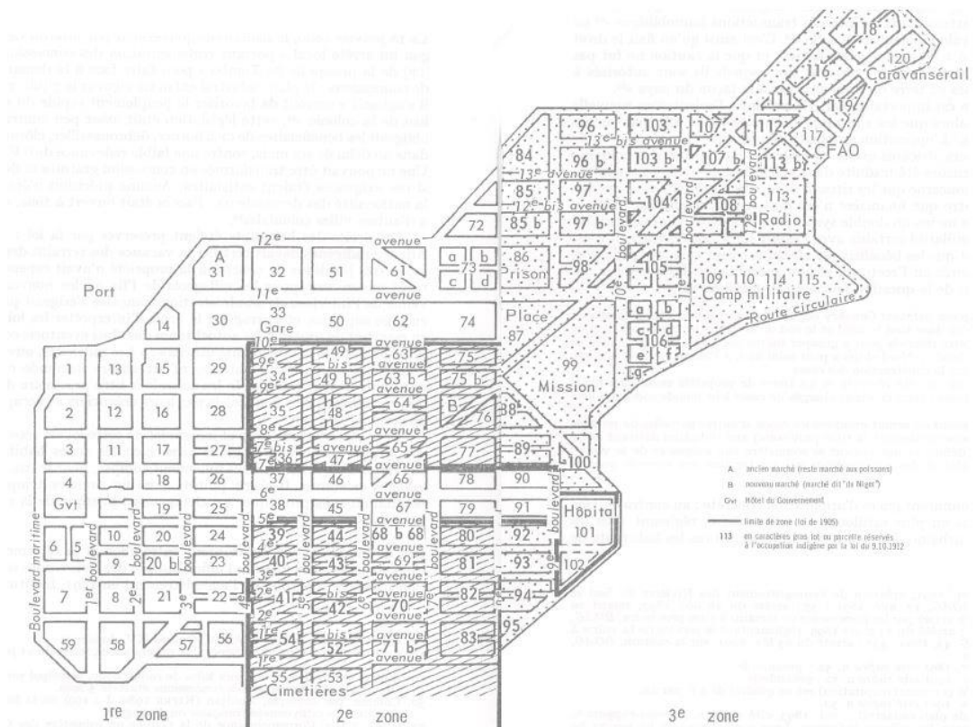
Figure 1 : plan de l'échiquier colonial vers 1910, position des lots réservés aux "indigènes".

Par ailleurs, ce qui pourrait être intéressant pour nous de souligner dans cette partie, c'est l'impact de cette nouvelle organisation spatiale sur les populations locales. En effet, l'analyse des discours produits par l'administration coloniale sur la ville de Conakry met donc en évidence la superposition de différents niveaux d'appréhension (foncier, juridique, judiciaire, municipal, urbanistique) d'où émerge progressivement une certaine image de la ville 19 . En délimitant la ville, l'administration conditionne aussi l'accès, symboliquement et concrètement tout en définissant théoriquement l'usage de l'espace. Face à cela, les mécanismes d'exclusion mis en œuvre sont frappants. Il s'agit d'une situation dans laquelle les citadins sont dépossédés de leurs biens et leurs possibilités d'action sont limitées par la loi. De plus, même la citoyenneté leur est refusée. En s'appuyant sur la prétendue nature rurale de l'Afrique, et donc sur la négation d'une urbanité endogène, l'idéologie coloniale française construit une ville basée sur un modèle dichotomique, défini par un espace administrativement borné, exclusif et hiérarchisé juridiquement 20 .