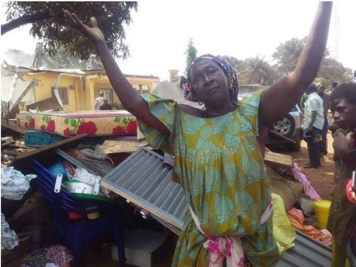
Photo 8 : une photo devenue virulente sur les réseaux sociaux, prise pendant le déguerpissement dont les victimes se servaient pour attirer l'attention de l'opinion public, Source : https://guineematin.com/tag/collectif-des-victimes-de-kaporo-rails/