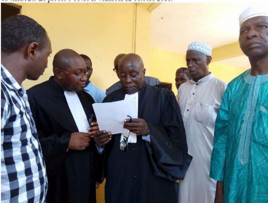
Le pool d'avocats qui a défendu les habitants de Kipé 2

Photo 5 : Le pool d'avocats en concertation avec le collectif citoyens victimes de déguerpissement.