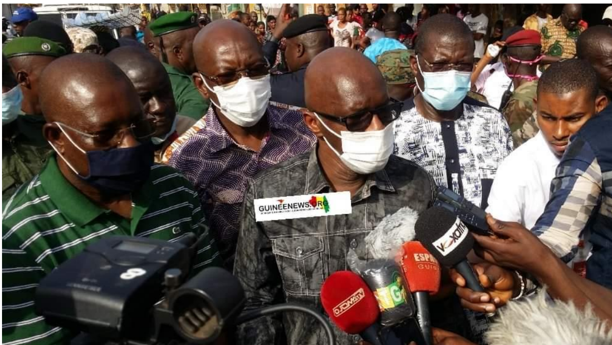
Photo 4 : Le ministre de l'urbanisme sur les lieux de déguerpissements à Kaporo-rails, entouré des hommes en uniformes.

En effet, l'attachement des élites guinéennes à l'idéologie de la ville occidentale moderne persiste encore de nos jours. Malgré les discours allant dans le sens de prendre en compte les pratiques locales et ses dimensions sociales, le constat est tout autre. Ce qui est frappant dans la situation de Kaporo-rails, c'est de voir les acteurs étatiques utiliser les mêmes méthodes que celles employées par l'ancienne puissance coloniale, quand il s'agit de déguerpir. La conduite des déguerpissements est une pratique diffuse dans le temps et dans l'espace des grandes métropoles du sud au point que l'on peut se demander si l'on n'assiste pas aujourd'hui, au renouvellement d'un ancien mode de production de la ville 51 . Au regard de la configuration actuelle de la ville de Conakry, avec toutes les difficultés liées aux logements, les transports et déplacements, le faible revenu des ménages, on peut sans doute affirmer que les déguerpissements d'aujourd'hui sont plus douloureux.