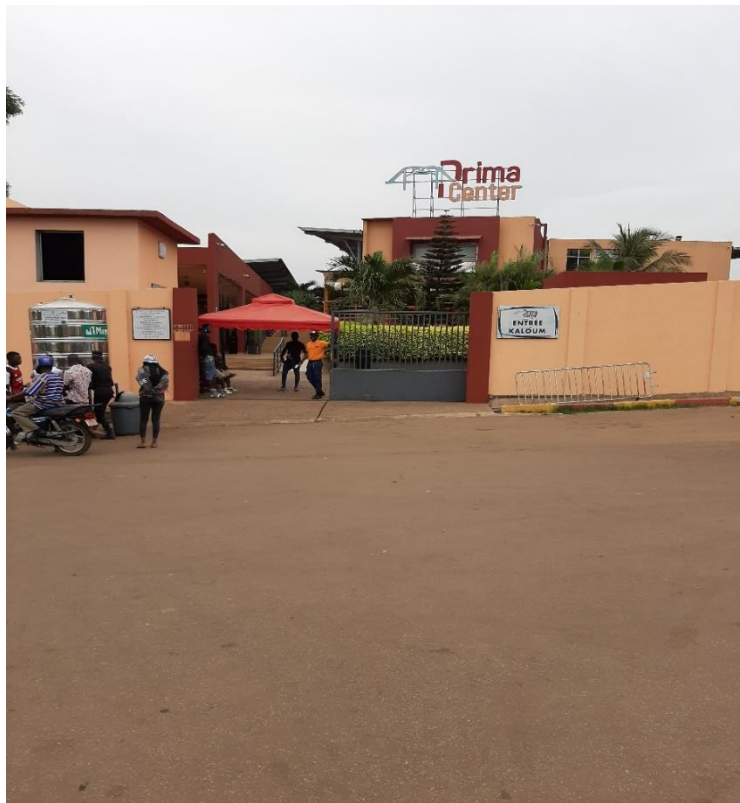
Photo 6 : Le centre commercial « Prima Center » situé dans la première partie déguerpie en 1998

annoncé un projet de construction de logements sociaux. Sur le terrain, les villas construites étaient hors portée du citoyen moyen. Le projet final véhiculait une forme de traitement différenciée des citoyens. En réalité, on se rend aisément compte que c'est une exclusion des pauvres les poussant à se réfugier dans les périphéries ou dans d'autres quartiers précaires. Cela nous amène à se poser la même question sur le cas de Kaporo-rails.