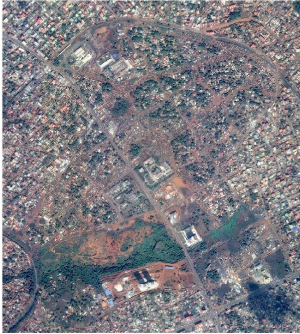
Images satellite avant et après les démolitions dans les quartiers de Kaporo Rails, Kipé 2 et Dimesse, à Conakry. Avant.