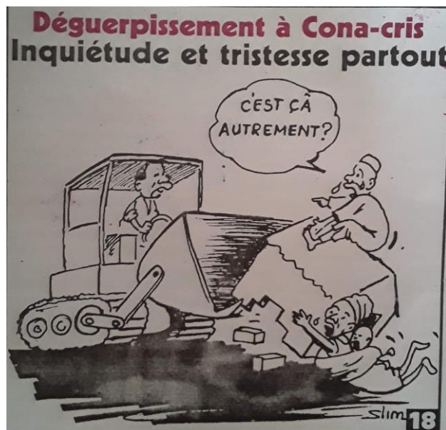
Figure 3 : Journal de la presse écrite traitant le sujet des déguerpissements. Ce journal issu d'un media local Le lynx, reprend le slogan du président Alpha Condé lors des élections, « Gouverner autrement »

Nous voilà arrivé à la troisième partie consacrée à notre terrain d'études. Dans cette partie, nous traitons le sujet des déguerpissements à une échelle locale au regard de la politique globale de l'Etat guinéen en matière de politique foncière.