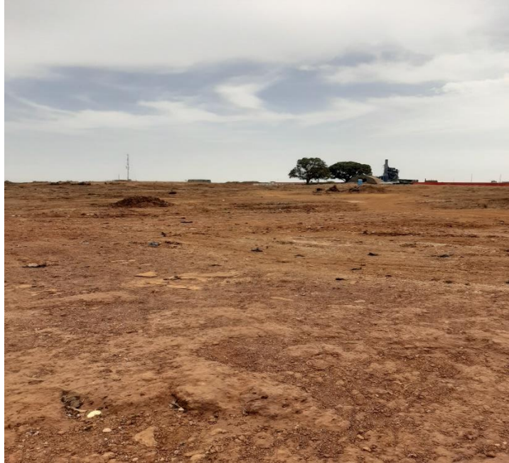
Photo 9 : après la démolition du site laissant le site totalement vide

Une fois les espaces déguerpis, se pose alors la question de ce qui va devenir les lieux. La forte mobilisation des citoyens de Kaporo-rails en 2019 s'explique par le fait que les promesses tenues par les pouvoirs publics sur le devenir des espaces démolis en 1998 n'ont pas été matérialisées sur le terrain. Entre la première et seconde démolitions, ces espaces sont longtemps devenus vides. Ce qui occasionne comme on l'a cité plus haut, d'autres formes de réappropriations. Le projet au nom duquel les citoyens ont été chassés tarde encore à voir le jour. Le peu de réalisations observées ne colle pas aux discours annoncés au départ. Finalement, pourquoi déguerpir ? Les anciens déguerpis du quartier s'accordent tous à dénoncer l'absence totale d'information sur le devenir des espaces libérés. Cela crée une frustration profonde de la part de déguerpis. Le devenir des espaces libérés par les déguerpissements peut engendrer une