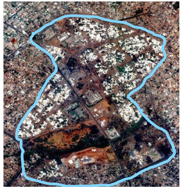
Photo 2 : Vue aérienne du quartier après démolition en 2019