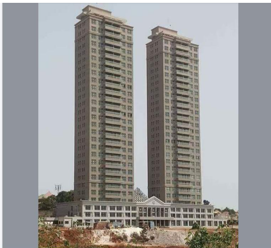
Photo 7 : Les tours jumelles de Kakimbo de 25 niveaux sur une superficie de 11 hectares. On voit bien à ce niveau l'influence des promoteurs immobiliers dans l'occupation des espaces déguerpis.

des équipements administratifs de Kaloum. Sur le terrain cet objectif est loin d'être atteint. D'un côté, des occupations spontanées et de l'autre côté le développement des projets immobiliers par des promoteurs qui affichent leur volonté de contrôler ces espaces. Finalement, si ce n'est pas pour réaliser les projets annoncés au départ pourquoi déguerpir ? D'autant plus que les nouvelles occupations, qu'elles soient reconnues ou non par l'Etat, ne suivent toujours pas le plan de planification urbaine. Le centre commercial « Prima Center » serait à l'emplacement prévu au plan de 1998 pour l'assemblée nationale (Bah, 2017) 57 . Au final, on le voit bien: ni le plan d'urbanisme ni la loi foncière ne sont respectés.