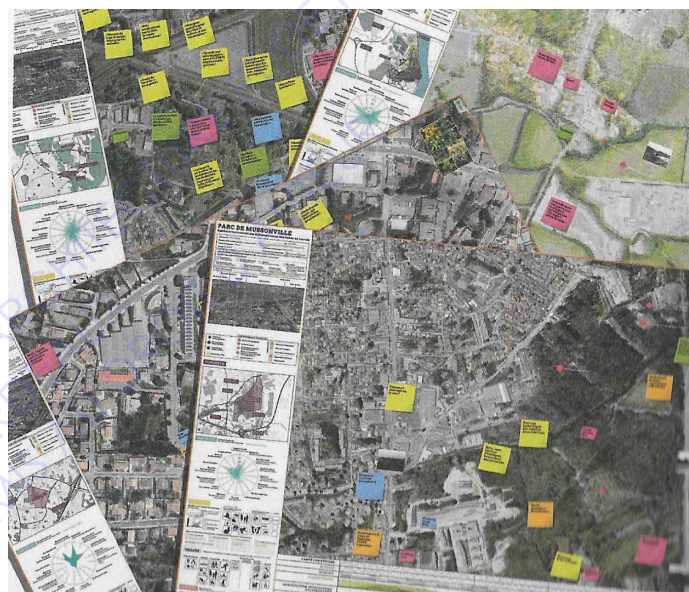
«Carte du bien commun» élaboration pour l'étude «55 000 hectares de nature», Bordeaux, 2014. Groupement Coloco et ADH. Ces cartes synthétisent la collaboration collective sur le terrain, compile les informations et les désirs des participants.

La commune de Gradignan pourrait alors appliquer cette forme de processus de projet dans les années à venir. Travailler avec des paysagistes, des habitants, l'équipe municipale et les agents sur le terrain afin de favoriser le commun. Au-delà du statut juridique de l'espace, repenser à l'échelle de la commune le collectif. Le glanage pourrait alors être un élément qui favoriserait les discussions autour de la gestion des espaces. La cueillette pour faire remonter des idées ou des envies autour des questions des d'agricultures urbaines. Utiliser ces pratiques comme support de discussions au début du processus de projet permet de dessiner des espaces plus collectifs.