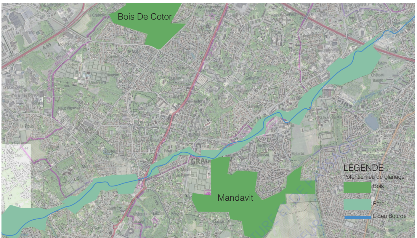
Cartographie des Potentiels lieux de glanage sur la commune de Gradignan au 1:15 000

Ayant déterminé avec la mairie, mais aussi grâce au travail d'arpentage les espaces clé sur la commune qui pouvaient être les plus intéressants pour le glanage, je me suis rendu sur place plusieurs jours afin de faire des observations et réaliser quelques entretiens avec des habitants. Cette expérience m'a permis de comprendre quelle place avait le glanage dans les paysages de la commune. L'objectif était alors d'interroger aussi bien des promeneurs que des glaneurs. Cette méthode d'entretien spontané m'a permis d'avoir un panel large d'utilisateurs de ces espaces et m'a aidé à comprendre la place du glanage dans les paysages de Gradignan.