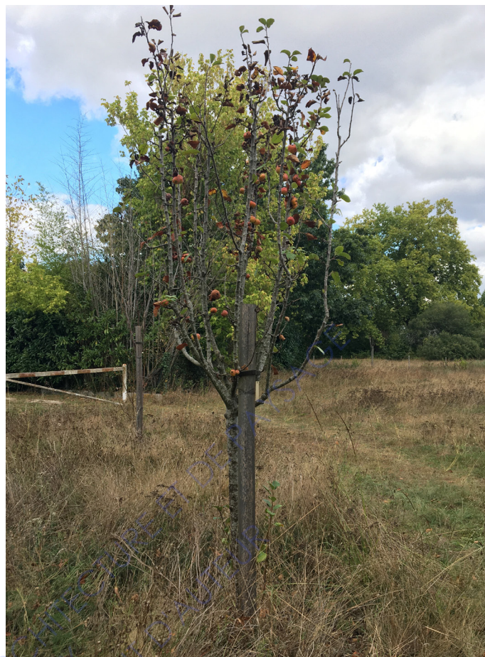
Verger urbain ; Pommier Photographie du vergé situé allée Paul Cézanne