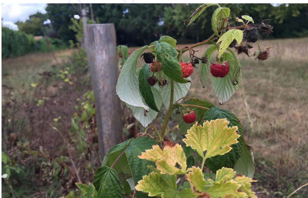
Verger urbain ; Framboisier Photographie du verger situé allée Paul Cézanne