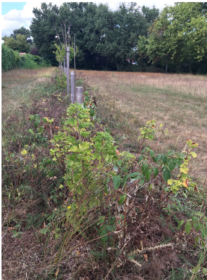
Verger urbain Photographie du vergé situé allée Paul Cézanne