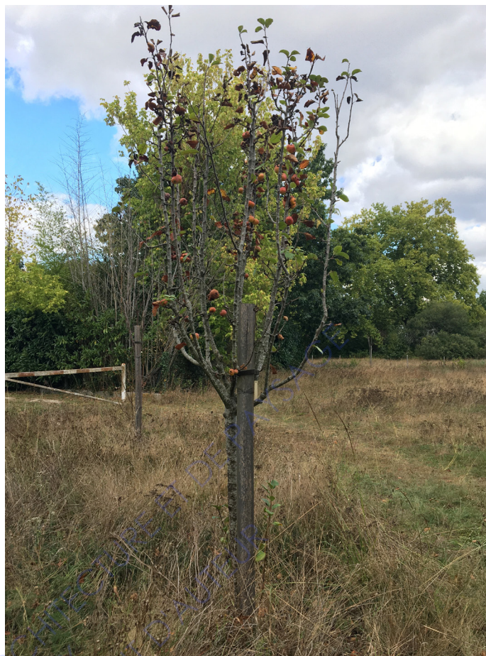
Verger urbain ; Pommier Photographie du vergé situé allée Paul Cézanne