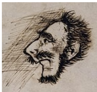
Figure 2. Dessin de Victor Hugo considéré comme étant un portrait de Thénardier. 45