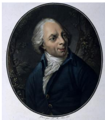
Figure 1. Exemple d'un portrait de l'abbé Delille 6 .