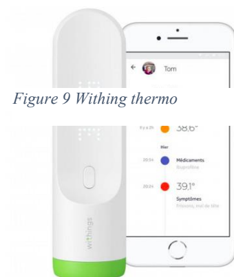
Figure 9 Withing thermo

Exemple : Le Withing Thermo est un thermomètre connecté, qui permet une prise de température au niveau temporel, via infra-rouge. La société Withing assure ainsi une mesure fiable et rapide grâce à 16 capteurs infra-rouge et sa technologie brevetée « hot spot sensor », permettant de réaliser 4000 mesures en deux secondes. Le développement de ce type de dispositif permet de simplifier la prise de mesure chez des patients réticents à la méthode classique tout en permettant une amélioration certaine de l'hygiène.