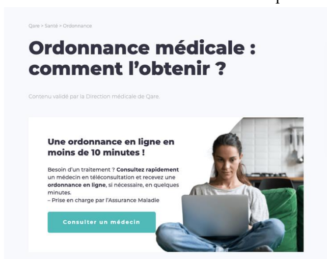
Figure 5 Capture d'écran Qare 32

Ces entreprises annoncent sur leur site des promesses alléchantes pour les patients qui rencontrent des difficultés à trouver un professionnel de santé rapidement.