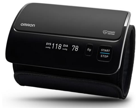
Figure 7: Tensiomètre OMRON EVOLV

Exemple : OMRON EVOLV, est un tensiomètre qui se présente sous forme de brassard tout en un. L'appareil est doté d'un guide d'enroulement permettant d'indiquer au patient le bon positionnement et le bon serrage du brassard. Il peut également détecter des pulsations irrégulières lors de la mesure.