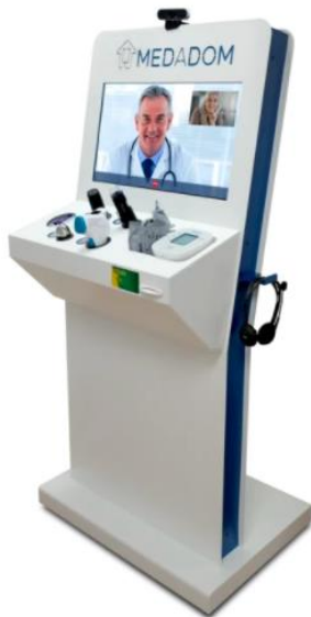
Figure 6 Borne de téléconsultation MEDADOM

La borne développée, est un atout majeur pour la téléconsultation, permettant de palier à certaines limites des téléconsultations classiques proposées par la concurrence.