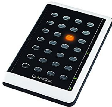
Figure 8: IMEDIPAC

Il propose une sonnerie au moment de chaque prise de traitement et éclaire la case à prendre, il peut également envoyer un sms en cas d'oubli. 50