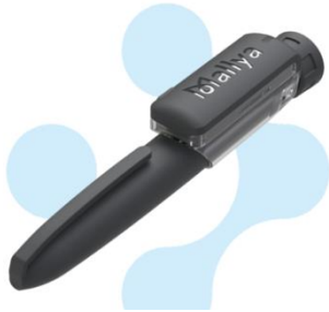
Figure 4 Mallya rend votre stylo injecteur intelligent

Votre stylo injecteur devient intelligent !