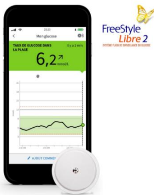
Figure 10 Capteur Freestyle Libre 2 et application Freestyle LibreLink

Pour résoudre une partie de ses problèmes la société Abbott® a développé un nouveau genre de glucomètre connecté : le Free Style libre et ses capteurs.